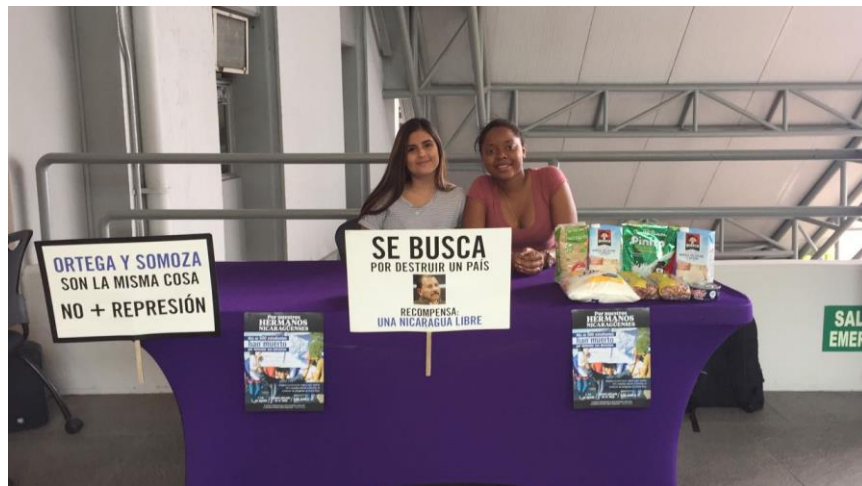
Ilustración 3: Campaña de recolección de víveres para personas solicitantes de refugio a raíz de la crisis en Nicaragua. La campaña fue liderada por los clubes estudiantiles.