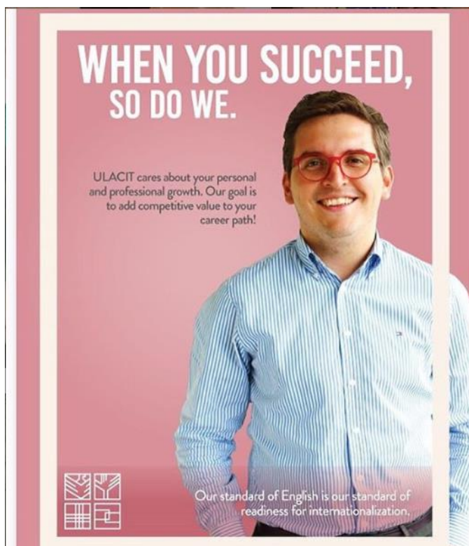
Ilustración 3: Campaña lanzada por la Dirección de Desarrollo Organizacional para promover los cursos gratuitos de inglés para el personal administrativo de ULACIT.