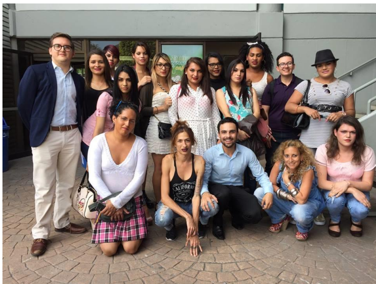
Ilustración 1: Primera generación del proyecto: “Zero to Hero”