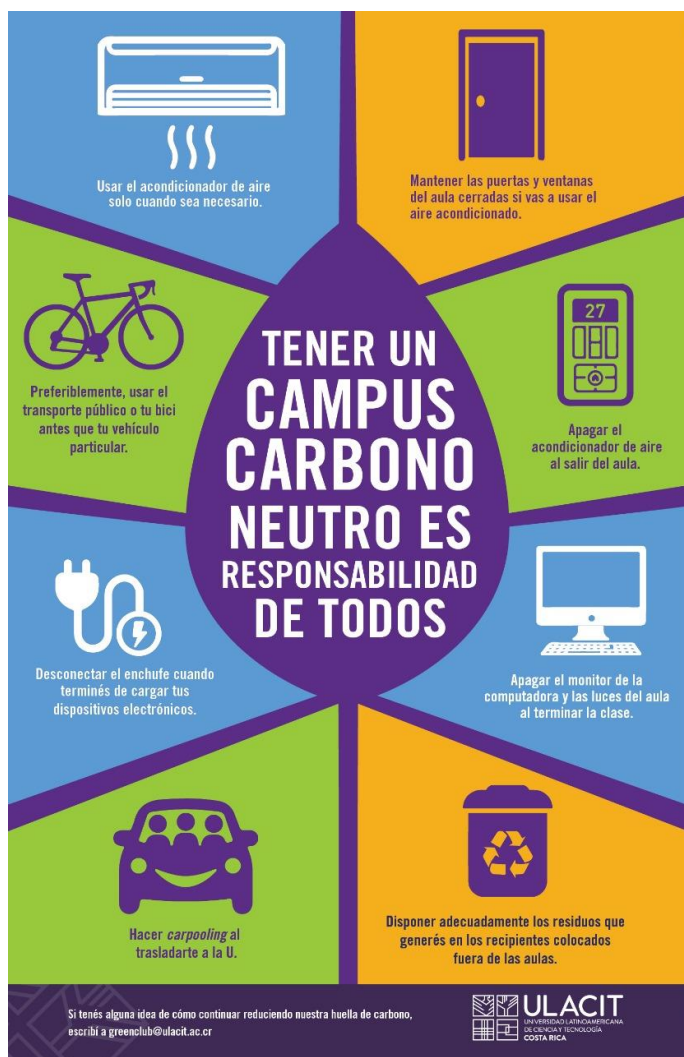
Ilustración 5: Campaña de sensibilización sobre la toma de acciones para alcanzar la carbono neutralidad.