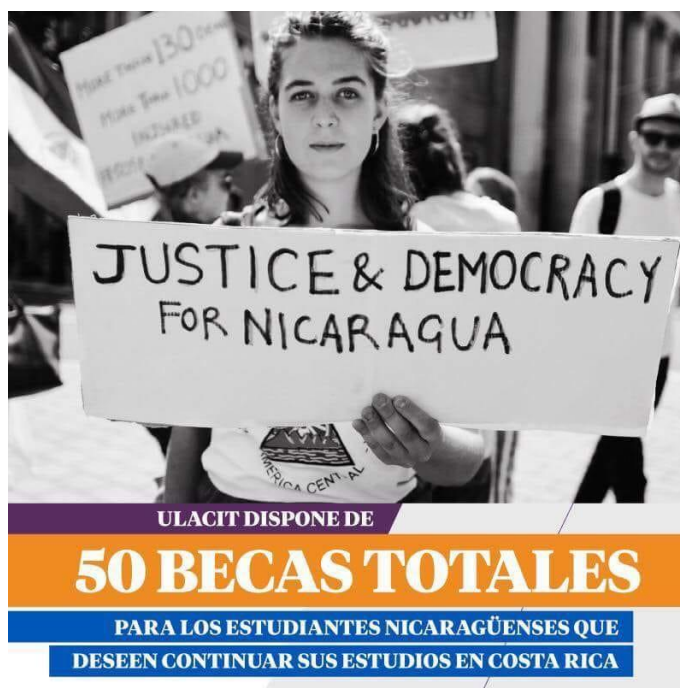
Ilustración 2: Lanzamiento de la campaña para las becas a refugiados nicaragüenses.