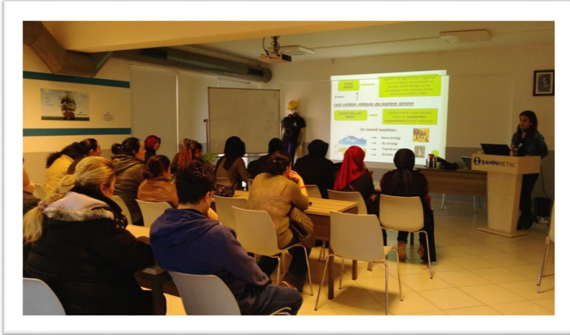
2018 Çevre Eğitimi Görüntü

2018 yılında tüm çalışanlar için çevre bilinci ve atık yönetimi konulu eğitimler tamamlanmış, bireysel farkındalığın ve sorumluluk bilincinin artırılması hedeflenmiştir.