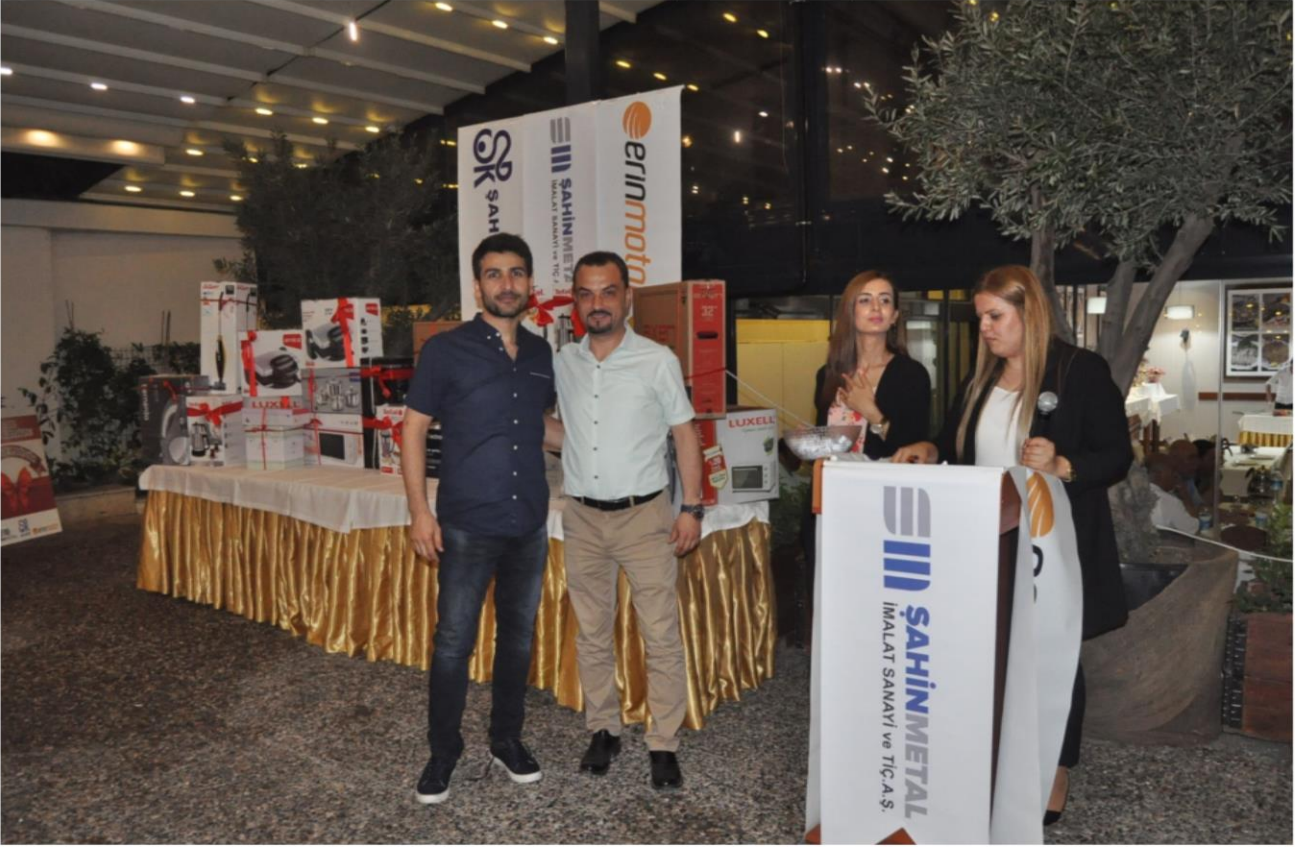
2018 yılında verdiğimiz iftar yemeğinden görüntüler