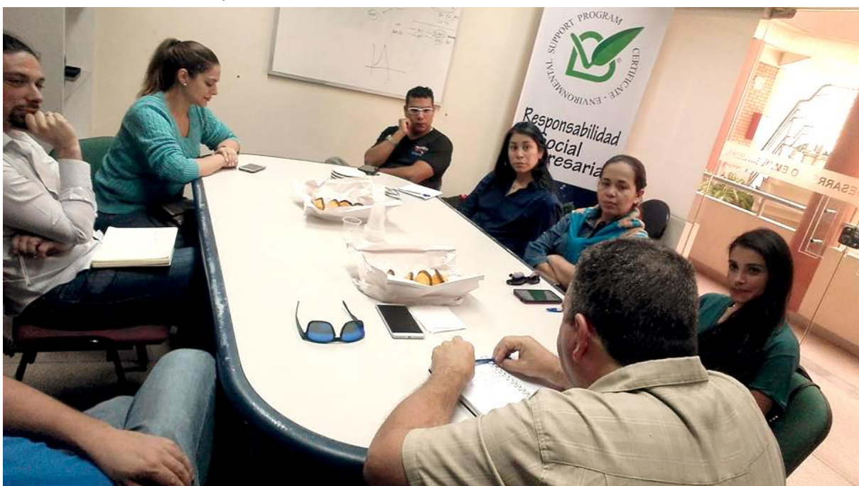
Compromiso Fundación Trabajo Empresa Scz