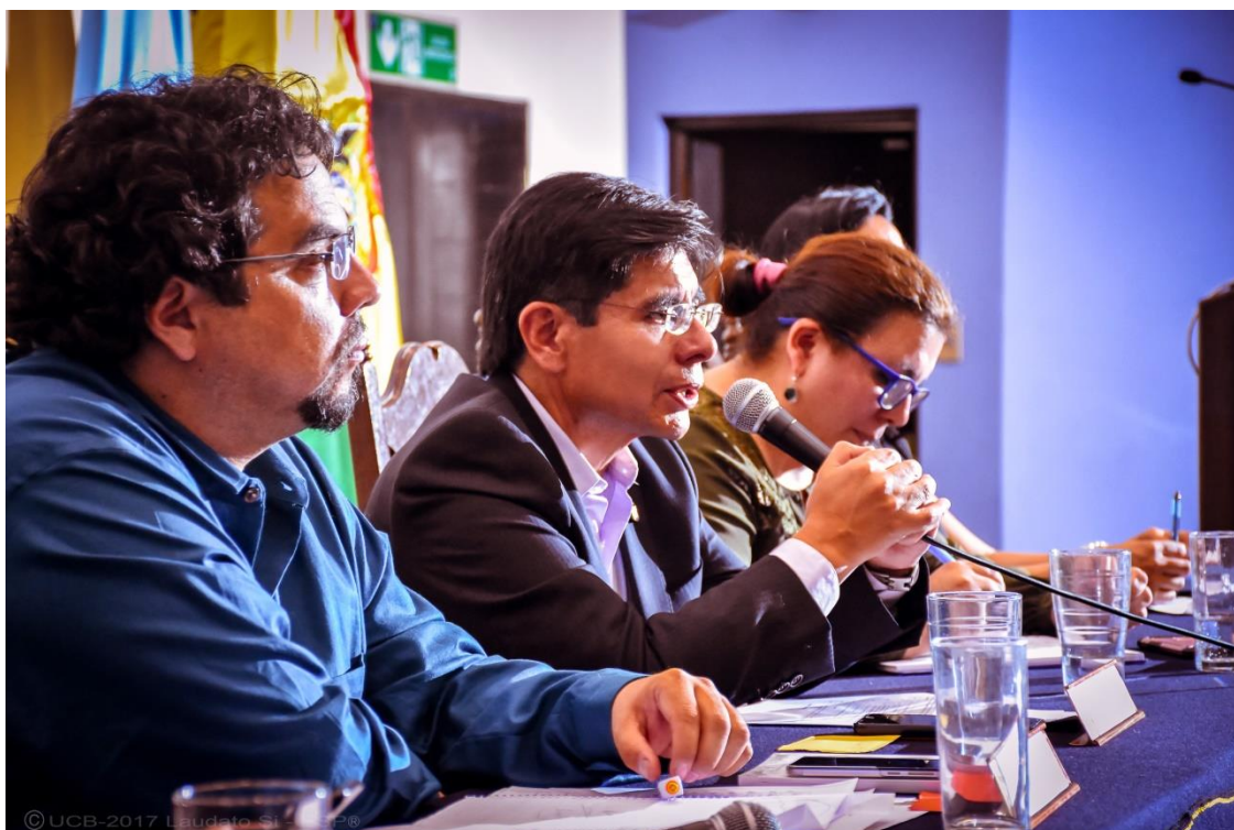
Foro Laudato Si, UCB – Panel Internacional