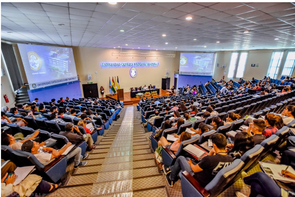
Lanzamiento de los compromisos ambientales LAUDATO Cbba. UCB