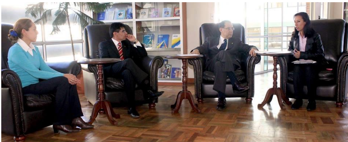
Convenio ESP®-Universidad Católica Boliviana “San Pablo” implementación de políticas y acciones de Responsabilidad Social Ambiental y mejora continua.