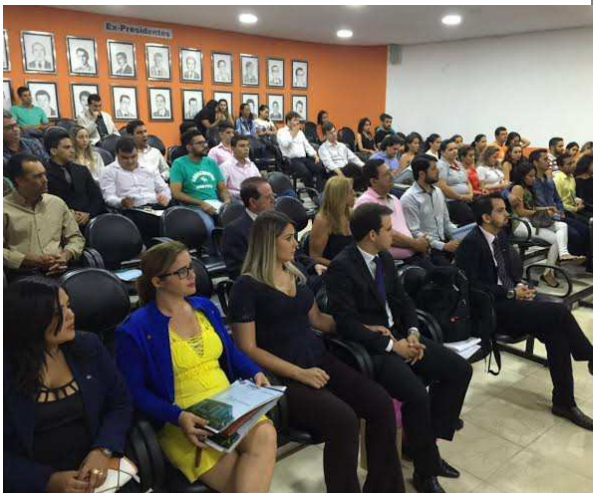
Palestra em Itaberaí ressaltando a ética profissional do Administrador e responsabilidade Social