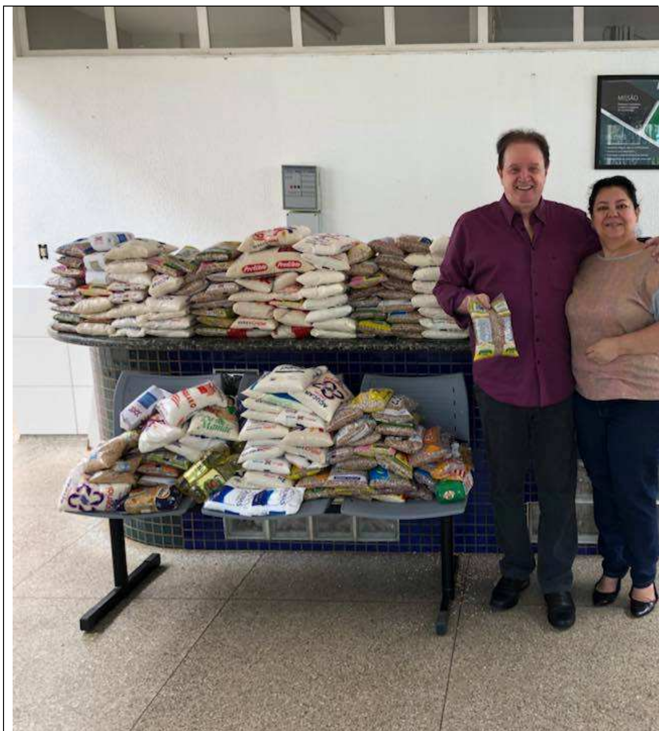
Doação de alimentos para hospital em Anápolis.