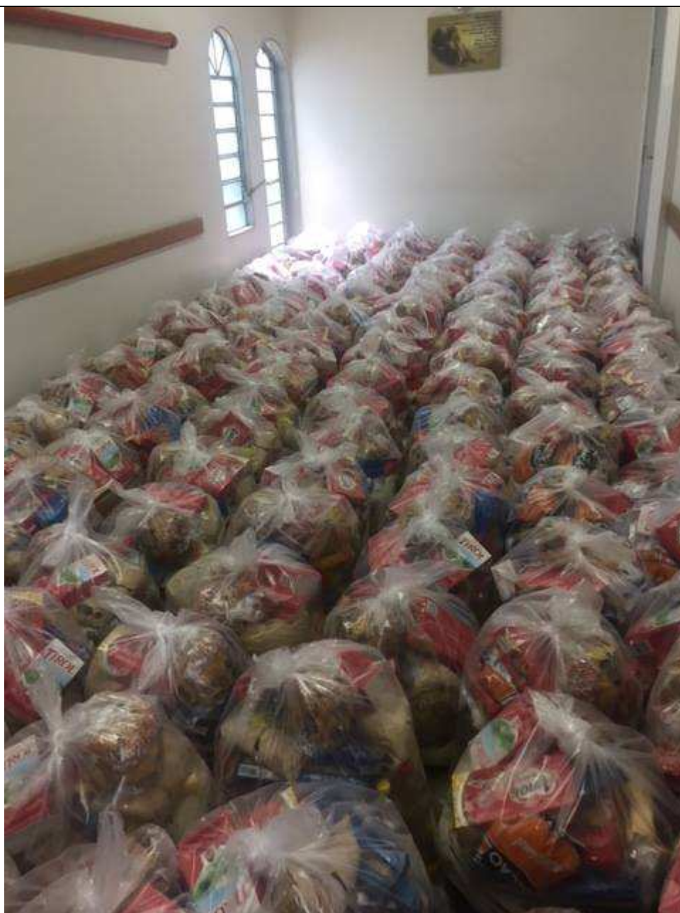
Campanha: Doação de cestas de alimentos.