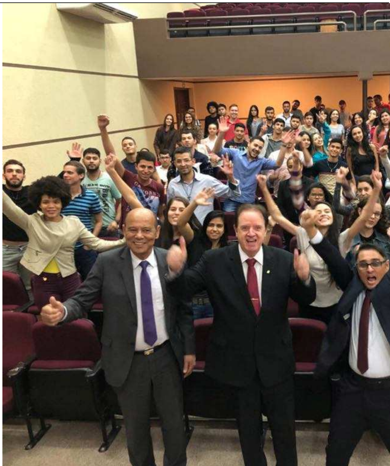
Palestra proferida no município de Anápolis.