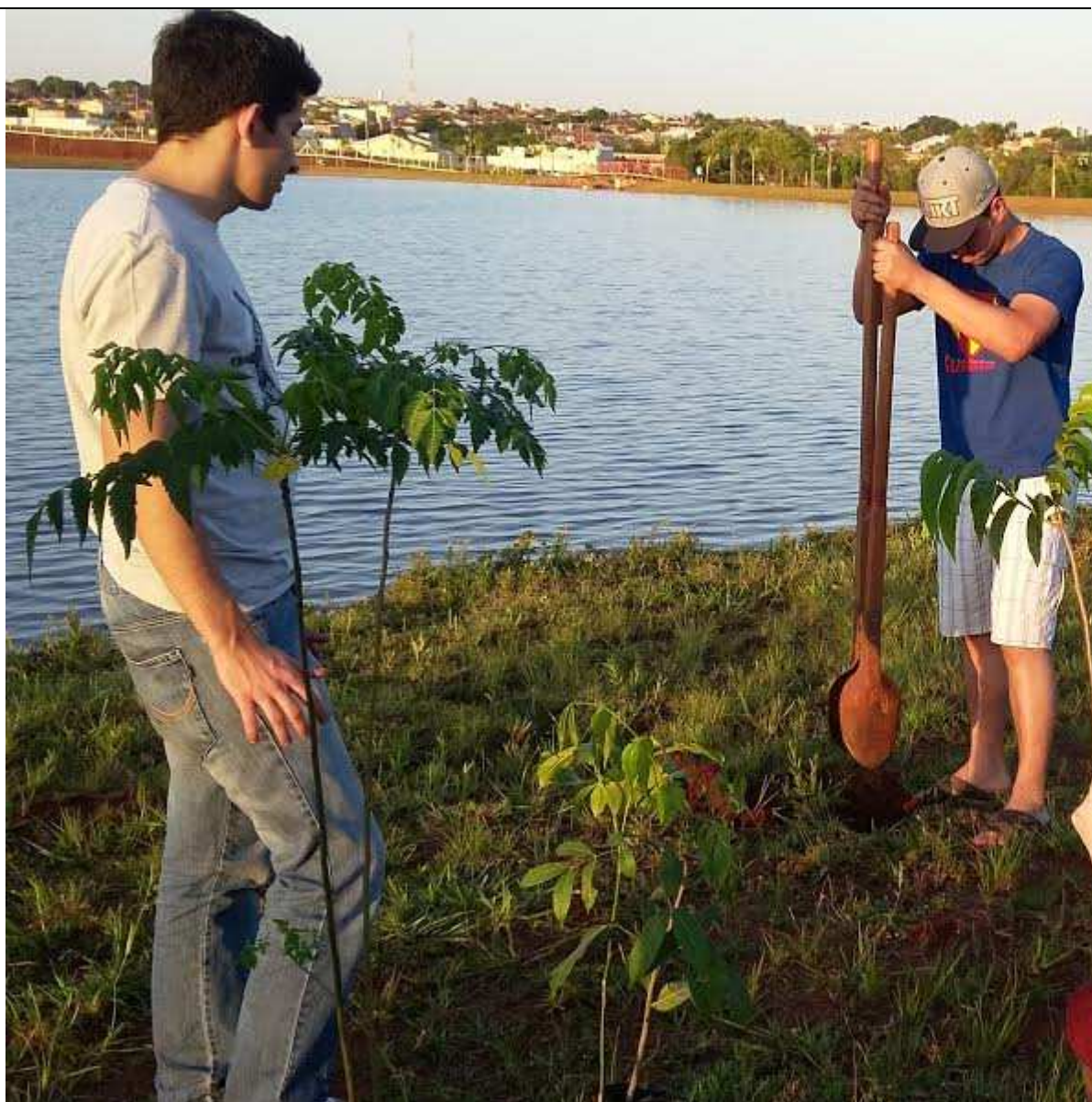
Plantio de mudas de árvores