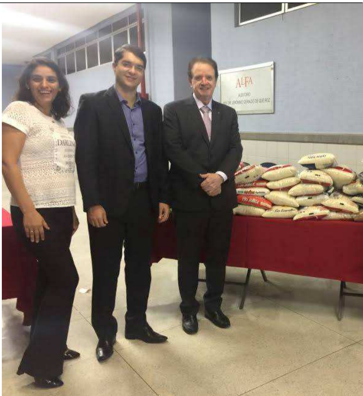
Arrecadação de alimentos com realização de palestra.