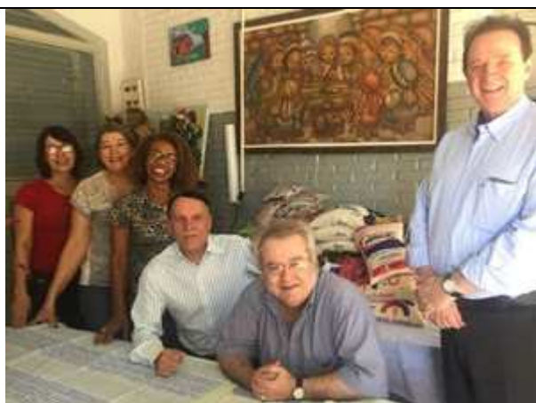
Doação de alimentos para creche em Goiânia.