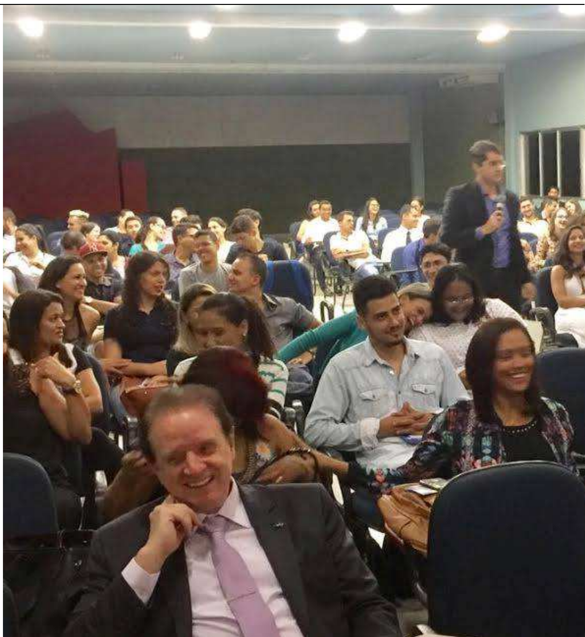
Campanhas sociais, palestras e arrecadação de alimentos, roupas e brinquedos.