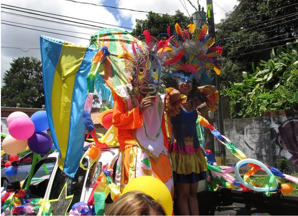
Brigadas de belleza