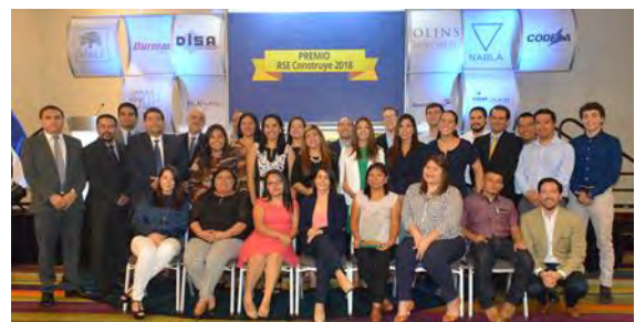
Categoría Gran empresa Empresa: Inversiones Bolívar, S.A. de C.V. Nuestra cultura de libertad con responsabilidad