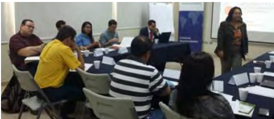
Capacitación a 11 empleados de empresas del sector construcción y de instituciones de gobierno para certificarse como Evaluadores de Competencias para el Sector Construcción.