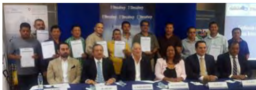
Certificación de 14 migrantes retornados en las áreas en que demostraron habilidad técnica: