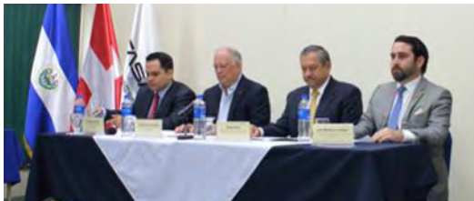
Convenio de cooperación interinstitucional para certificar las competencias laborales de migrantes que han ganado experiencia laboral dentro del sector construcción en el país norteamericano.

Acciones que se llevaron a cabo durante esta primera fase fueron: