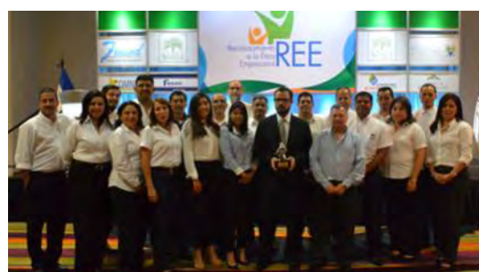
Ganador año 2017 Mexichem El Salvador /Amanco