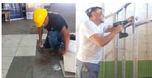
Proceso de evaluación de competencias laborales de los Migrantes Retornados.