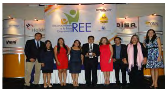
Ganador año 2016 Plycem Construsistemas

Para seleccionar a la empresa ganadora, se realiza un proceso por parte de un comité evaluador, donde se valoran las buenas prácticas realizadas por estas empresas y el cumplimiento realizado en las siete materias de responsabilidad social, según la ISO 26000.