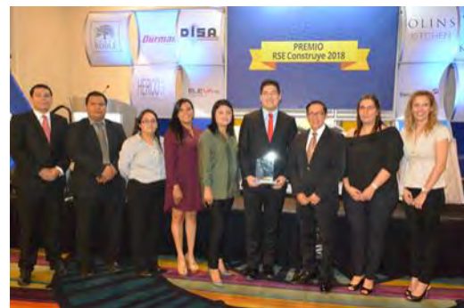
Categoría Mediana empresa Empresa: Blokitubos, S.A. de C.V. Buena práctica: Bloki Voluntario

Se entregó el Premio RSE Construye, en su primera edición, a dos empresas agremiadas.