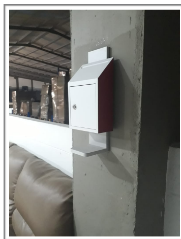
Buzón de sugerencias donde empleados pueden compartir inquietudes y recomendaciones hacia la empresa.