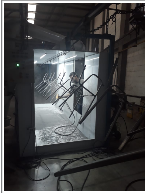
Horno de pintura electrostática.