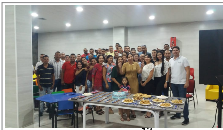
Despedida de fin de año 2017 - 2018.