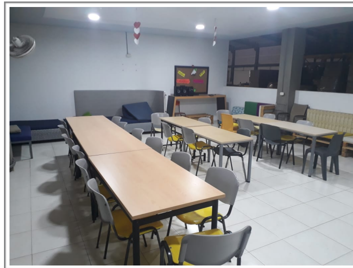
Zona de comidas y descanso para empleados.