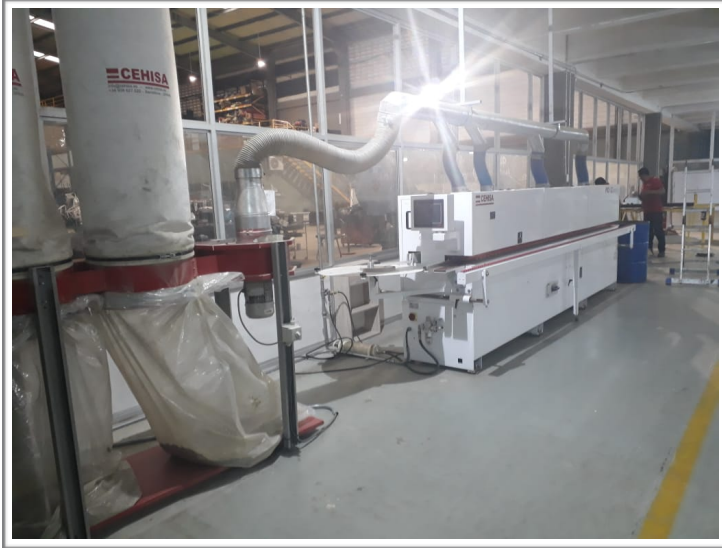
Motores de extracción de polvo en el departamento de madera.