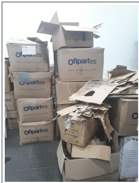
Cuarto de manejo de residuos reciclables.