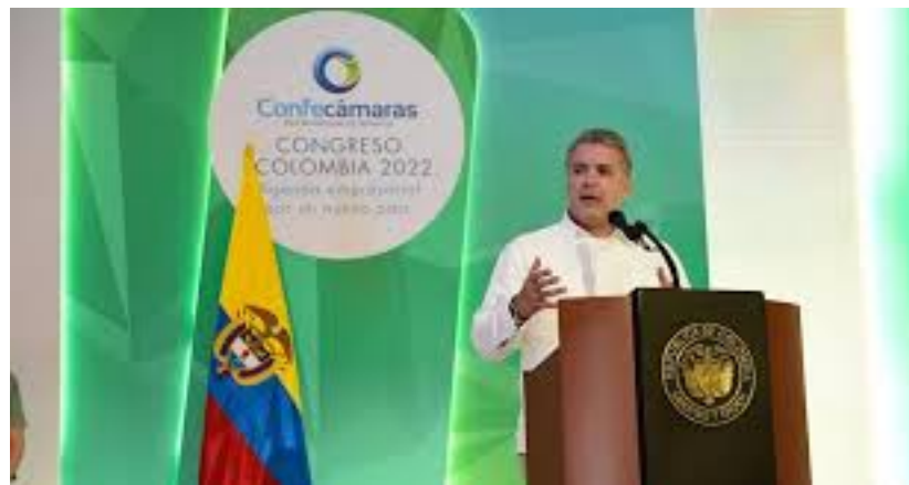
13 Sept. 2018. Oficaribe asistió al evento de Confecámaras donde las empresas líderes de cada Cámara de Comercio del país fueron invitadas para conocer las reformas en las políticas empresariales y la situación socioeconómica al inicio del nuevo periodo presidencial.

No existe otra empresa con tal incorporación de diseño, servicio y estándares de producción en la región del Caribe colombiano. Por ese motivo, las labores de crecimiento y expansión de la empresa han sido reconocidas por las agencias gubernamentales, las cuales sostienen a Oficaribe como un referente de empresa líder y emprendedora que demuestra la labor de los empresarios colombianos, superando retos y creando, en cambio, nuevas oportunidades.