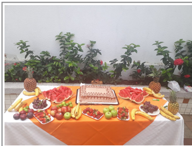
Mesa de frutas en evento de integración para promover hábitos de vida saludables.