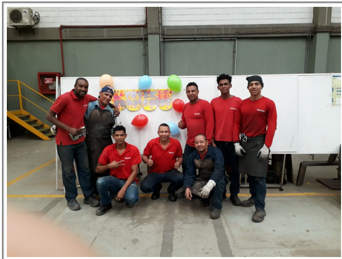
Celebración de cumpleaños de nuestros empleados como método de integración.