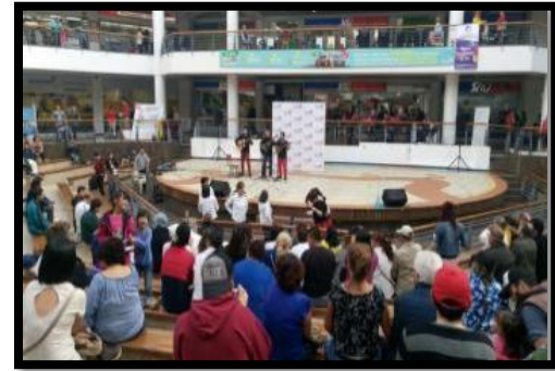
En Julio 16 Presentación Musical de la Armada Nacional para la celebración del 20 de Julio