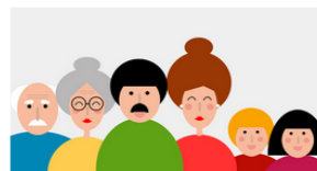
Infancia y Familias