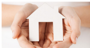
Servicio de atención domiciliaria