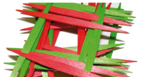
Personas en riesgo de exclusión social