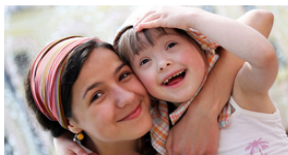
Personas con discapacidades