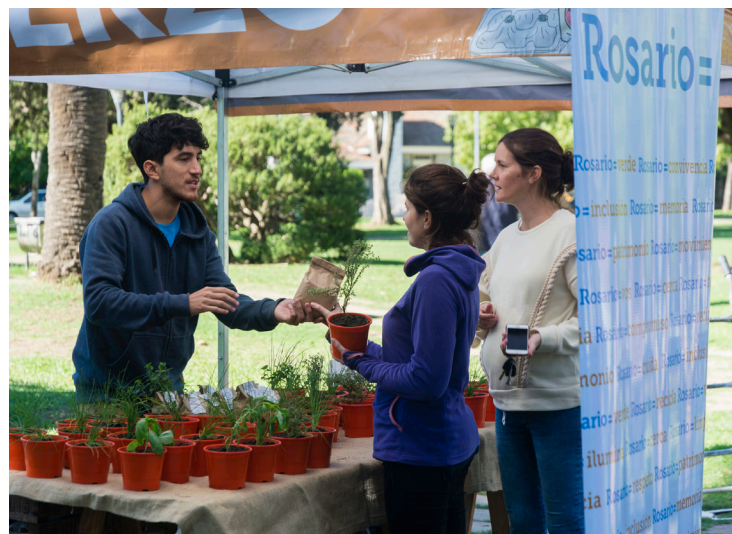
Predio de Bella Vista: Plantas de Tratamiento

➤ Canjes Saludables es una actividad itinerante que promueve la separación de residuos en origen, y que propone la reducción de la cantidad de desechos enviados a disposición final. Se realiza canjeando una bolsa de residuos reciclables por verduras o carga de tarjeta del sistema público de transporte. De este modo, se incentiva a la movilidad sustentable y al consumo de verduras orgánicas producidas por huerteros del Programa de Agricultura Urbana (PAU).