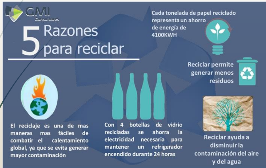
Cartel "Razones para reciclar"