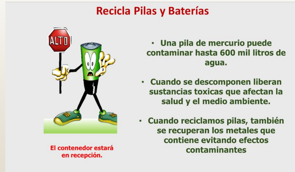
Cartel "reciclaje de pilas"