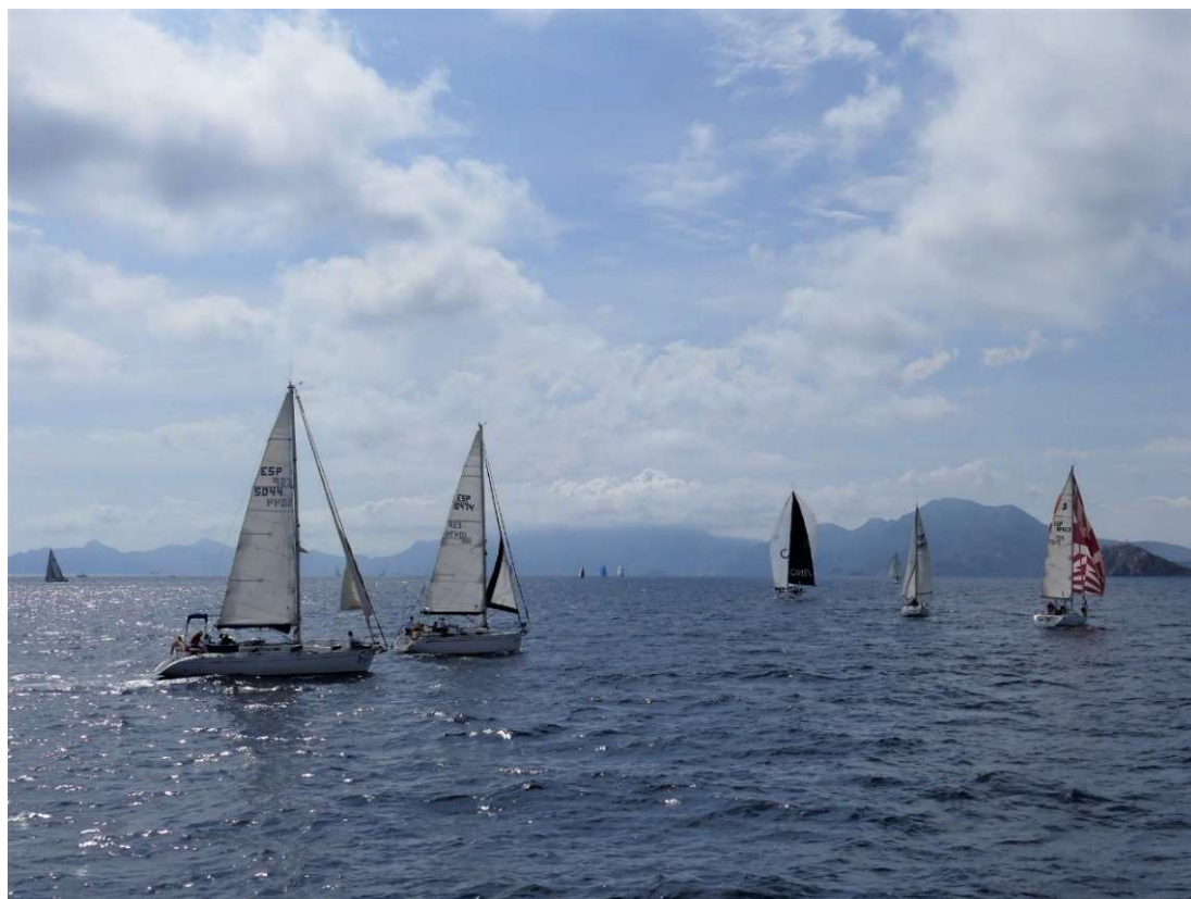
Foto: Dentro de la Bahía. Se disfrutó de una jornada espectacular gracias a las condiciones meteorológicas.

Y así finalizaba esta Edición de una Regata Solidaria que sigue creciendo y ya navega hacia su décimo aniversario, con el objetivo de enrolar a más instituciones, patrocinadores y armadores en una nueva causa solidaria.