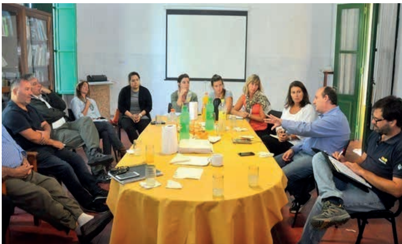
INTA, Parques Nacionales, Municipio, Urbania y diferentes actores intervinientes