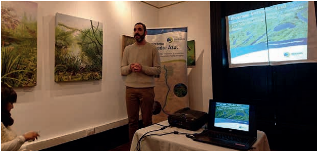
Primer encuentro lanzamiento en San Fernando