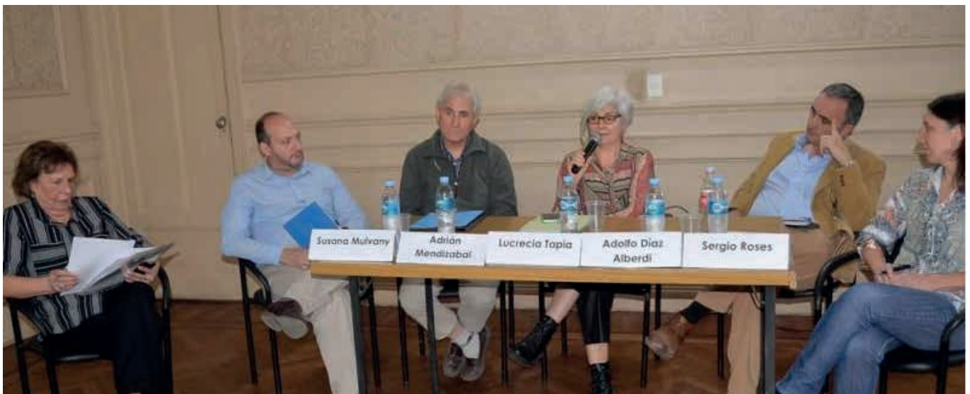
Panel de apertura del segundo encuentro