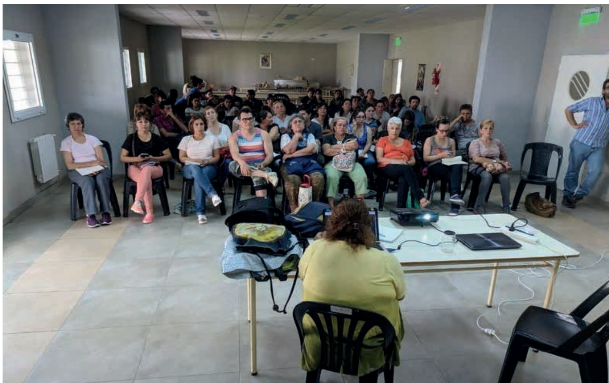
Vista de los participantes del curso.