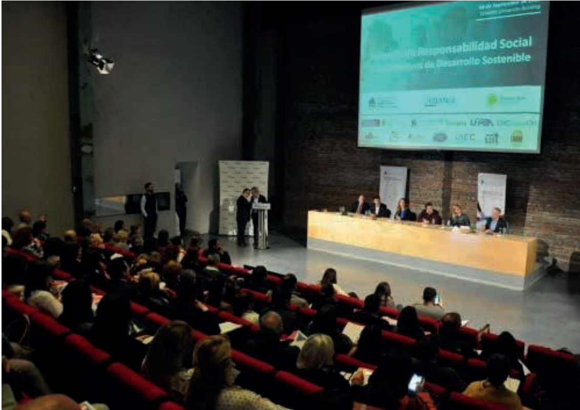
Vista público en general