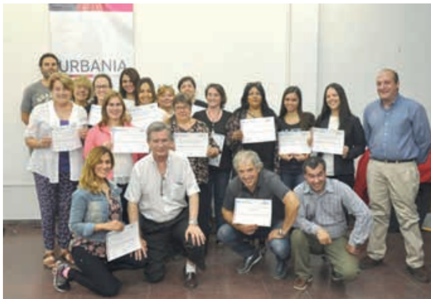
Alumnos del Programa Ejecutivo edición 2017

Unidad 16: Las ciudades sostenibles y emergentes.: Definiciones. Las formas de cómo lograr una ciudad sostenible. Limitaciones para que nuestras ciudades sean sostenibles. Ejes, actores, causas y soluciones para una ciudad sostenible. Las 10 ciudades que lideran la sostenibilidad urbana. ¿Cómo gestionar una ciudad emergente? Modelo de ciudades sostenibles. Planificación.