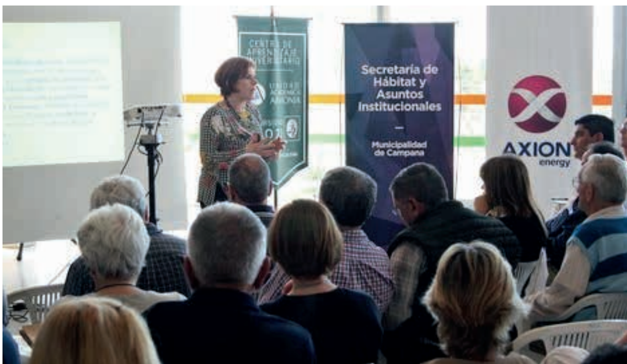
Exposición desde la unidad académica armonía