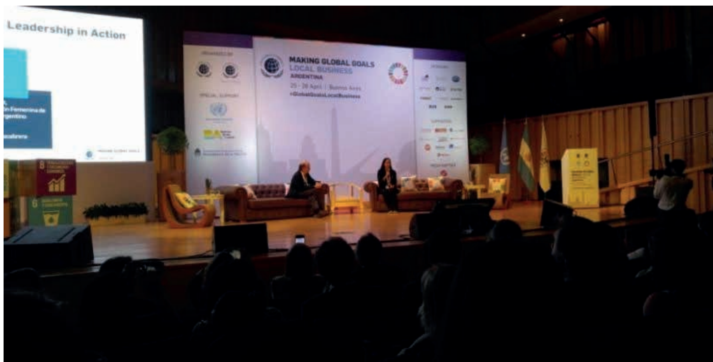
Vista general del evento