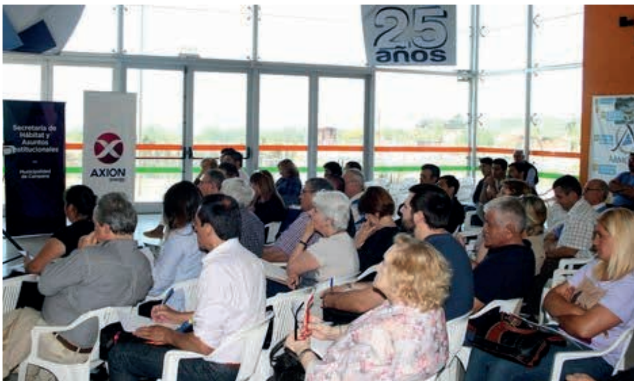
Vista general del evento