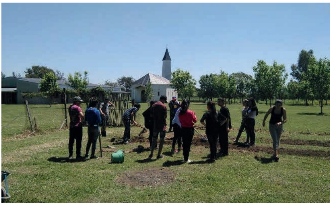
Jovenes del Programa Envi3n, participando de la primera etapa de la huerta