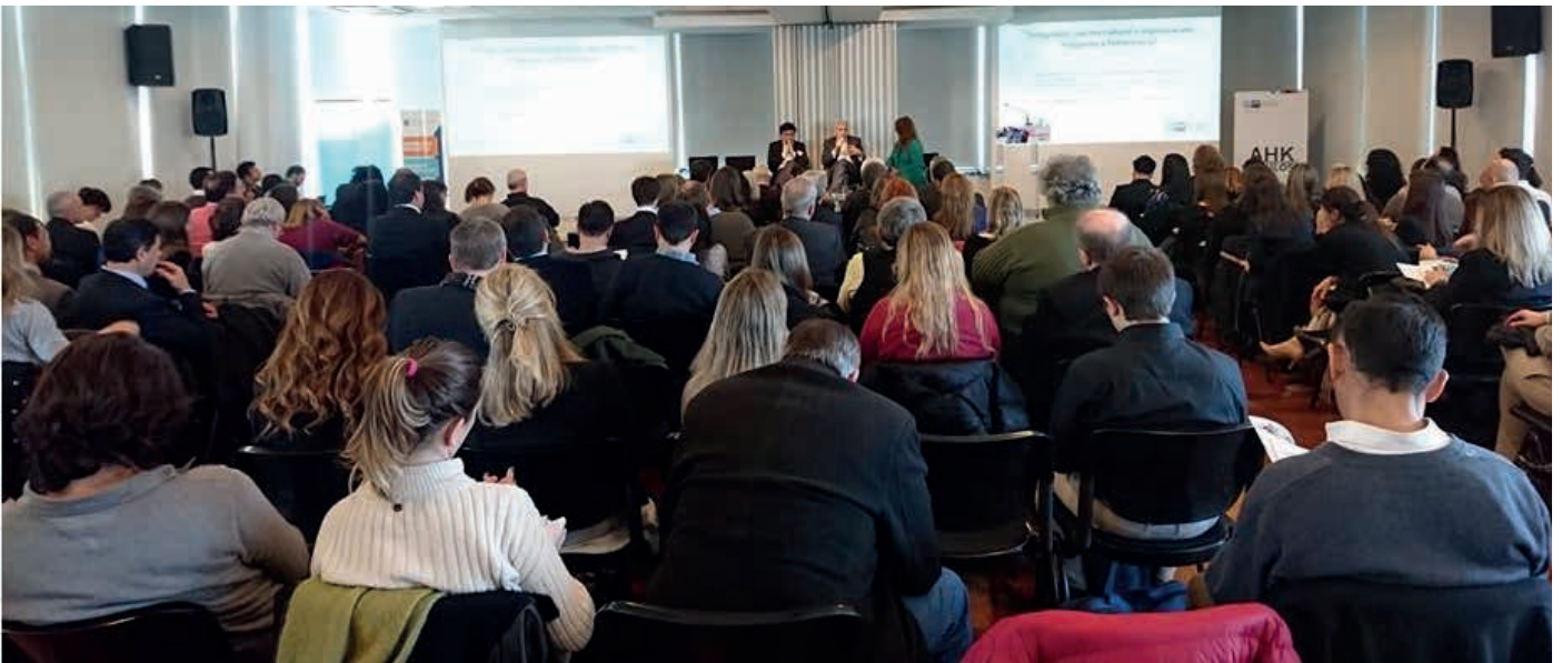
Vista General del Evento

En el marco del G20 Argentina 2018, el Centro de Competencia de Compliance de la AHK Argentina, organizó su tercer foro sobre integridad, transparencia y prevención de la corrupción. El enfoque general del evento busca la cooperación entre el sector público, el sector privado y la sociedad civil para mejorar la transparencia alineado a la Cumbre de Líderes en la que los países miembro se comprometen a crear políticas públicas para el progreso. La Fundación Urbania participó de este importante encuentro de la AHK.