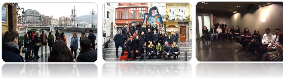
Ilustración 4: Imágenes de jornadas de capacitación en las que ha participado Factor durante 2017

Por otro lado, en 2017 la organización ha participado en diversas jornadas de temáticas relacionadas con la protección del medio ambiente y el desarrollo sostenible. En este sentido, Factor considera de vital importancia continuar con este tipo de difusión, tanto social como empresarial, de cara a promover el crecimiento verde como uno de los pilares fundamentales de su filosofía. Es por ello que se promueve en su comunicación a través de las herramientas de difusión existentes como la página web, las redes sociales o los boletines informativos editados por Factor de manera gratuita, así como en las notas de prensa elaboradas a este respecto.