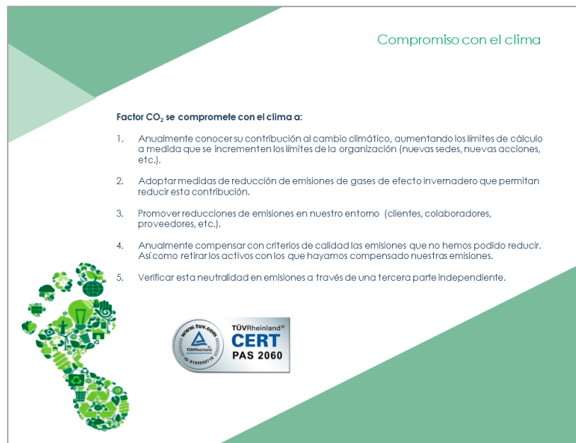
Ilustración 6: Compromisos con el clima de Factor

Factor continúa con la compra de sistemas informáticos, impresoras eficientes, y papel certificado con el sello de Ecolabel. La organización controla el impacto de sus acciones sobre el medioambiente por ello estudia e identifica todos los aspectos derivados de su actividad empresarial.