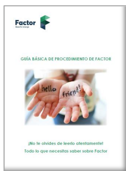
Ilustración 1: Portada del Manual de Organización elaborado por Factor

de actuación, prevención de riesgos laborales, anexos explicativos en torno a las herramientas de trabajo, etc.