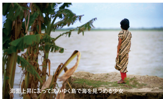
海面上昇によって沈みゆく島で海を見つめる少女