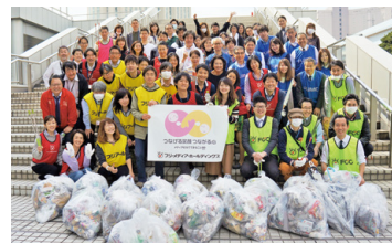
2018年3月の清掃活動には、70リットルのゴミ袋18個分のゴミを回収

今ではすっかり定着し、参加者は毎回70人を超え、美しい街づくりに貢献しています。