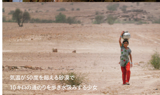
気温が50度を超える砂漠で 10キロの道のりを歩き水汲みする少女