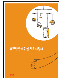
부정판단기준 및 행동지침