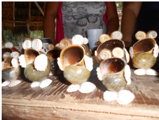
Varios modelos artesanales son desarrollados cuidando la calidad, actualmente se apoya con el desarrollo de el empackado y etiquetado.