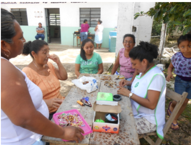
Cada semana una instructora de HUNAB visita las comunidades impartiendo los talleres de elaboración de artesanías