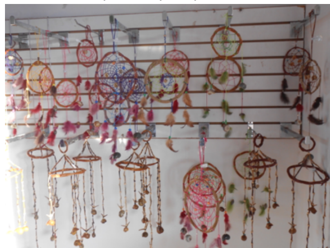
Durante la Feria de Tizimín de los Reyes, los artesanos tuvieron el apoyo para ofrecer sus productos