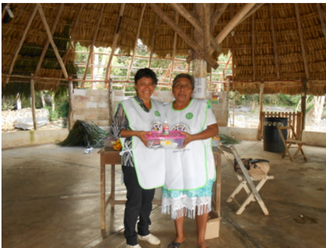
Entrega de materiales para iniciar sus trabajos artesanales.

Con el apoyo de Fundación Walmart de México, el ayuntamiento de Sinanché, Ayuntamiento de Tizimín y Mudanzas Continental, 85 emprendedores, en su mayoría mujeres, se encuentran produciendo el caracol manzana maya y otras especies nativas. Con las conchas de estos caracoles están elaborando artesanías. Han iniciado la comercialización de sus productos. HUNAB apoya con la capacitación para la producción acuícola un método desarrollado en la institución para producir los caracoles de forma artesanal y orgánica, a la vez brindamos seguimiento para garantizar que sus productos sean vendidos a precios justos y los productores desarrollen experiencia y mejora en su calidad de vida. Para conocer más sobre sus productos y ofrecer oportunidades de venta a los artesanos usted puede escribir a acuacultura@hunab.info