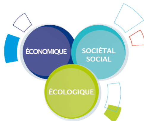
Les 3 piliers Bluegreen

Porté par notre Projet d'Entreprise, notre groupe familial a souhaité développer une politique de responsabilité sociale, sociétale et environnementale très concrète. BlueGreen, notre démarche de développement durable depuis 2008 constitue l'une des 3 priorités transversales de ce projet d'entreprise.