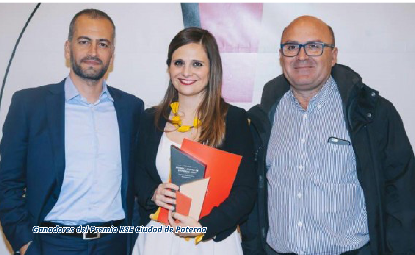
Ganadores del Premio RSE Ciudad de Paterna