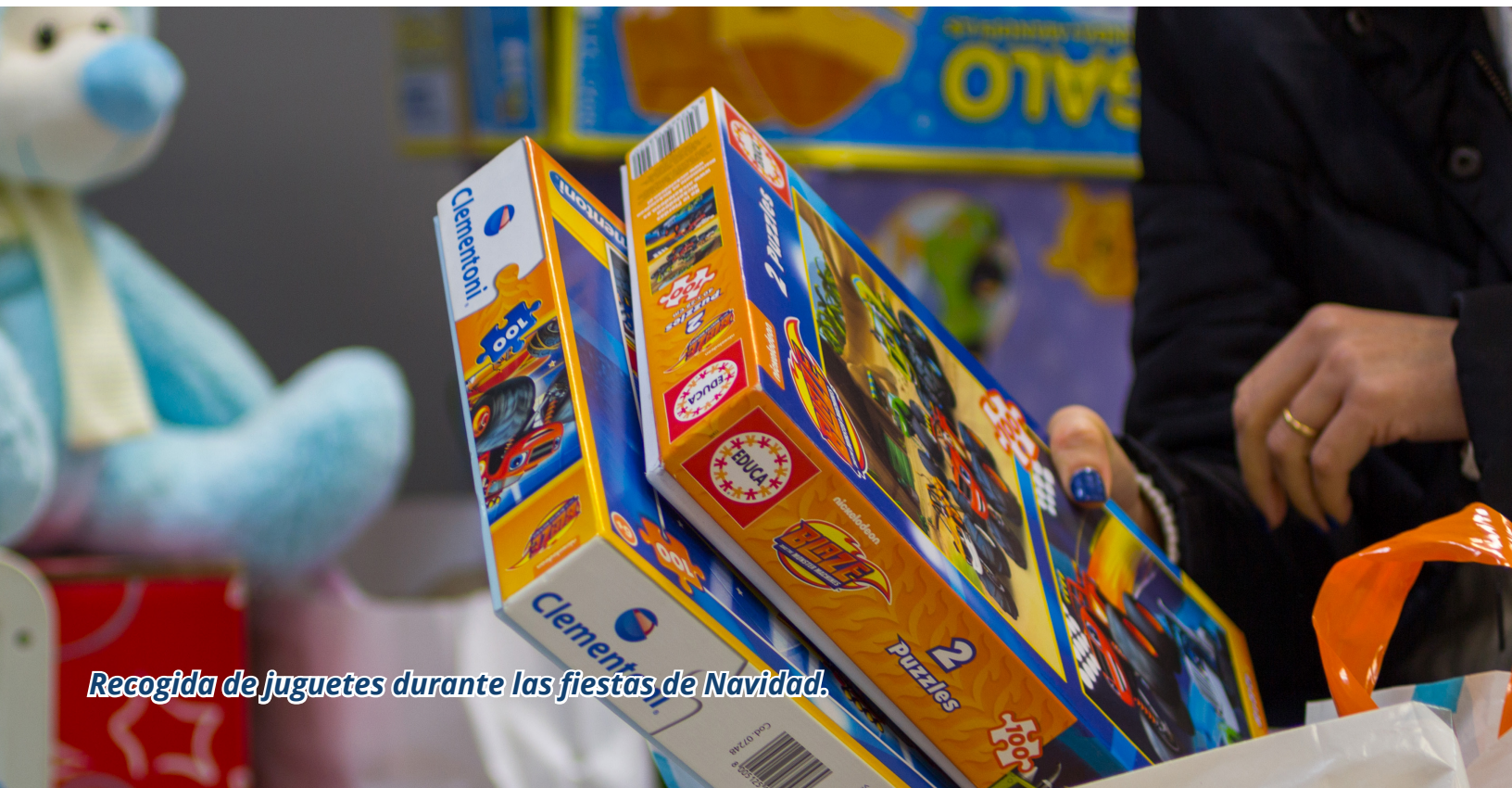
Recogida de juguetes durante las fiestas de Navidad.

Para difundir nuestras acciones de RSE contamos con un apartado en la web: EMPRESA RESPONSABLE, donde informamos de nuestra estrategia y acciones. Algunas de estas acciones también las comunicamos a la sociedad a través de notas de prensa para medios de comunicación y de las redes sociales. Fruto del trabajo realizado, el 8 de noviembre se nos otorgó el premio RSE Ciudad de Paterna, un galardón que reconoce la mejor estrategia en Responsabilidad Social Empresarial durante 2017 en la ciudad de Paterna.