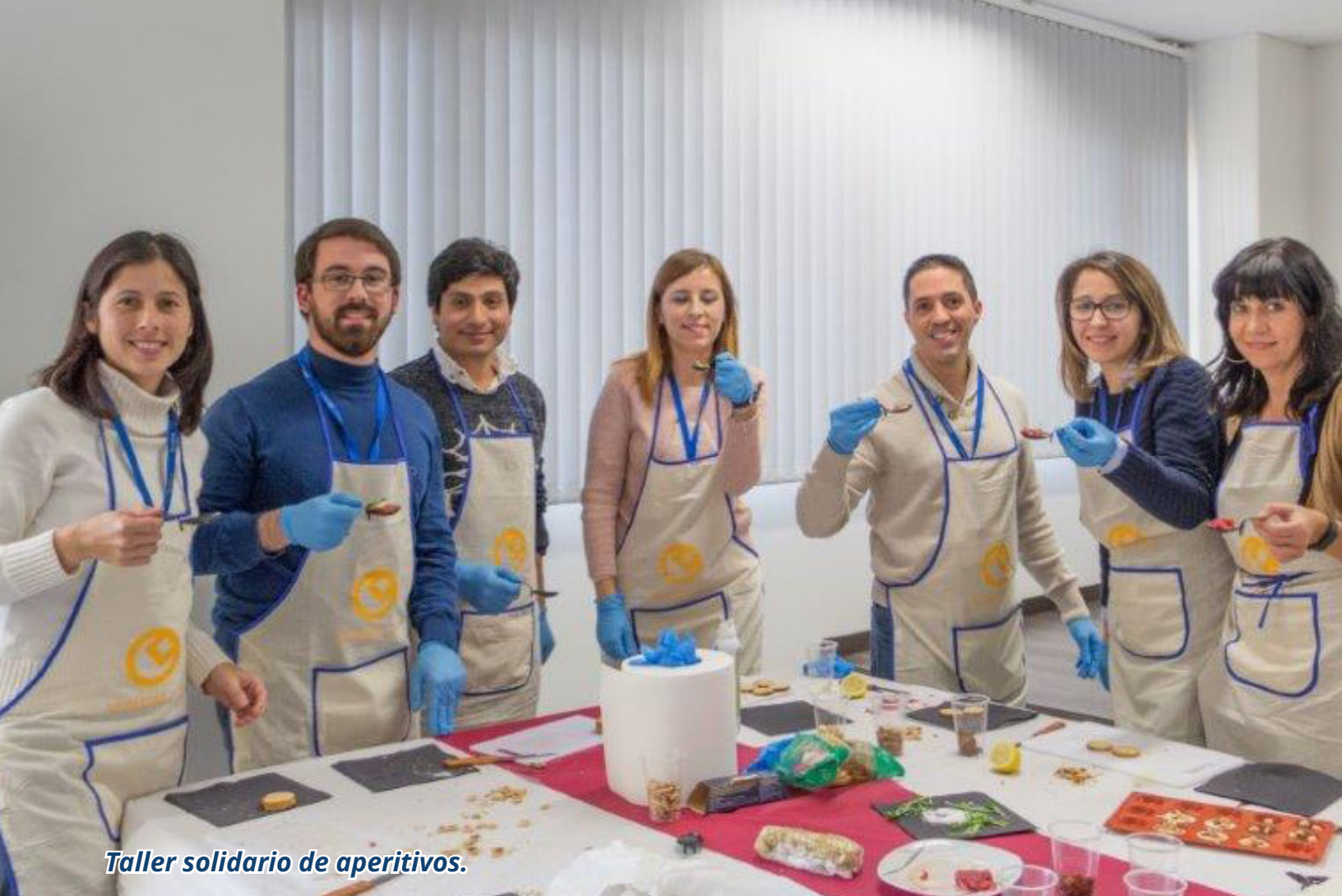
Taller solidario de aperitivos.