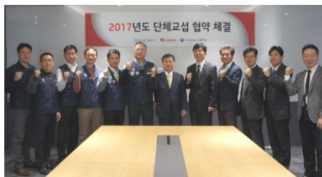
'17년 단체교섭 협약 체결