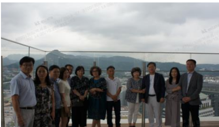
직원 가족 초청이벤트