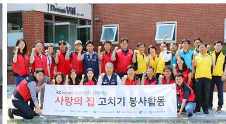
사랑의 집 고치기 봉사활동