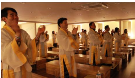
정년퇴직 예정자 생애설계 교육