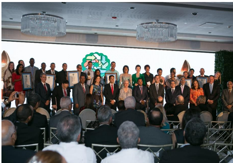
Foto No. 5. Ganadores, finalista y donantes en el Premio Ecológico a la Siembra de Agua realizado en el año 2017

Categoría B: denominada Premio Eugenio de Jesús Marcano Fondeur, reconociendo iniciativas de conservación de bosques para la protección de fuentes importantes de abastecimiento de agua, con adicional consideración hacia la preservación de especies