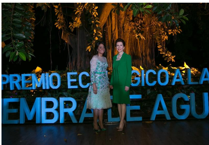
Foto No.4 La Presidenta de la Fundación Sur Futuro la Señora Melba Segura de Grullón con la Primera Dama de la República la Señora Cándida Montoya de Medina en la inauguración del Premio Ecológico a la Siembra de Agua del año 2017

Si bien en nuestra sociedad se da, por un lado, una falta de conciencia casi generalizada del valor del cada vez más limitado recurso agua; por otro lado, en el país abundan los casos de