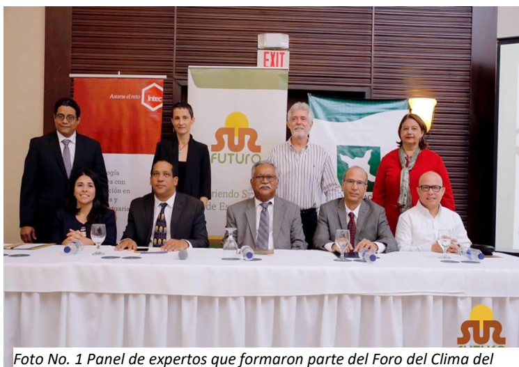
Foto No. 1 Panel de expertos que formaron parte del Foro del Clima del Clima en el día mundial del Medio Ambiente

Con motivo del Día Mundial del Medio Ambiente, impulsado por la Organización de las Naciones Unidas (ONU), y cuyo fin es estimular a nivel mundial la conciencia sobre el ambiente y fomentar la atención y la acción política se desarrolló el Foro Dominicano de Cambio Climático.