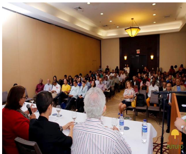
Foto No. 2 Participantes del Foro Dominicano de Cambio Climático

El Capítulo Nacional de Transparencia Internacional y movimiento cívico no partidista, Participación Ciudadana, junto al Instituto Tecnológico de Santo Domingo (INTEC) y la Fundación Sur Futuro, presentaron como parte de una alianza estratégica que busca impulsar un espacio de diálogo activo entre todos los sectores de la sociedad civil que permita la