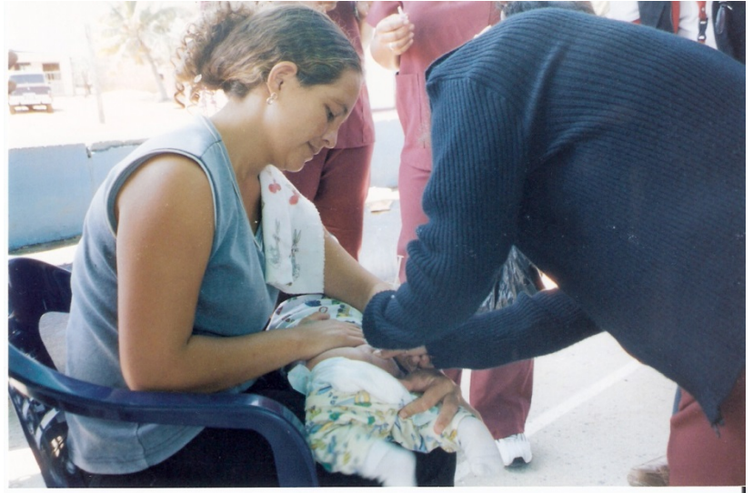
Jornada de vacunación a niños y adultos.