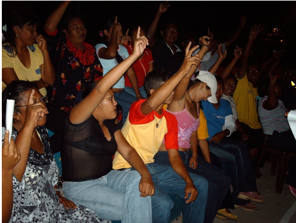
Fomentando la organización en las comunidades.

CONSIVE ha impartido talleres sobre la importancia de la contraloría social en el entorno de las comunidades y las organizaciones públicas y privadas (empresas).