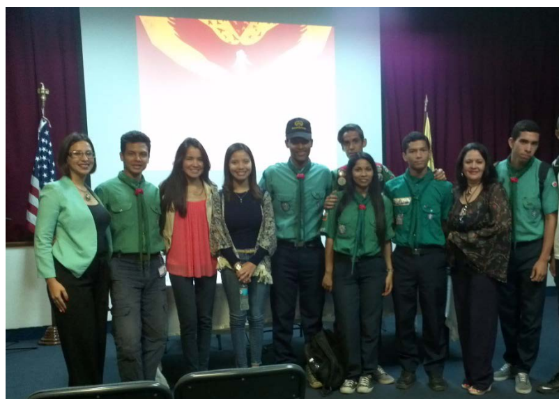
Encuentro en CEVAZ - ZULIA