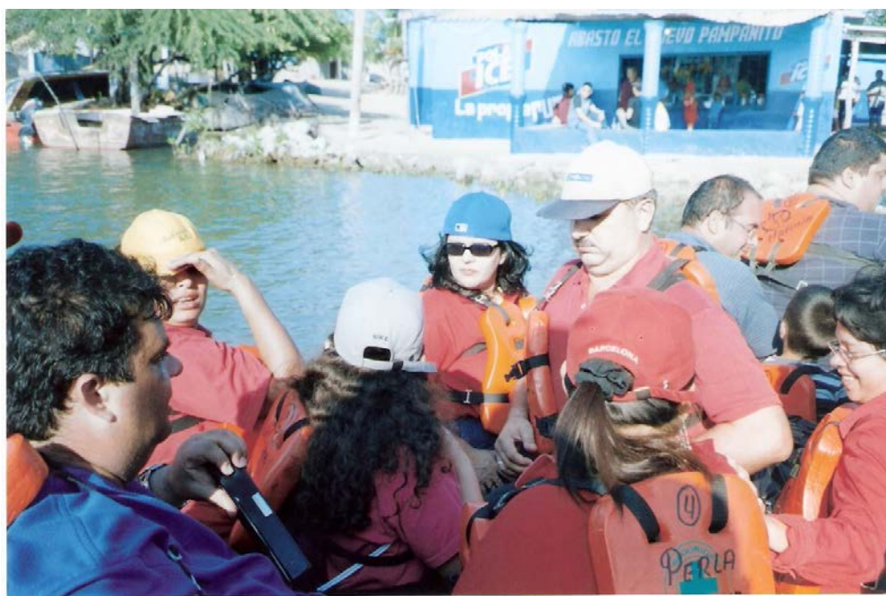
Equipo de CONSIVE llegando a la isla de San Carlos.