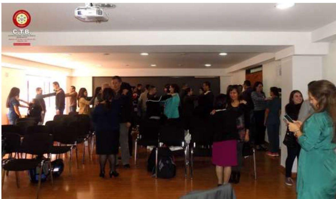
Actividades generadas para mejorar la convivencia y el clima laboral de los funcionarios administrativos y docentes, para evitar factores de riesgo psicosocial como la discriminación entre otros.

Es importante resaltar que los juicios al seleccionar personal, están ligados únicamente a su formación personal, laboral y profesional, y experiencia laboral acorde a las condiciones del cargo a ocupar.