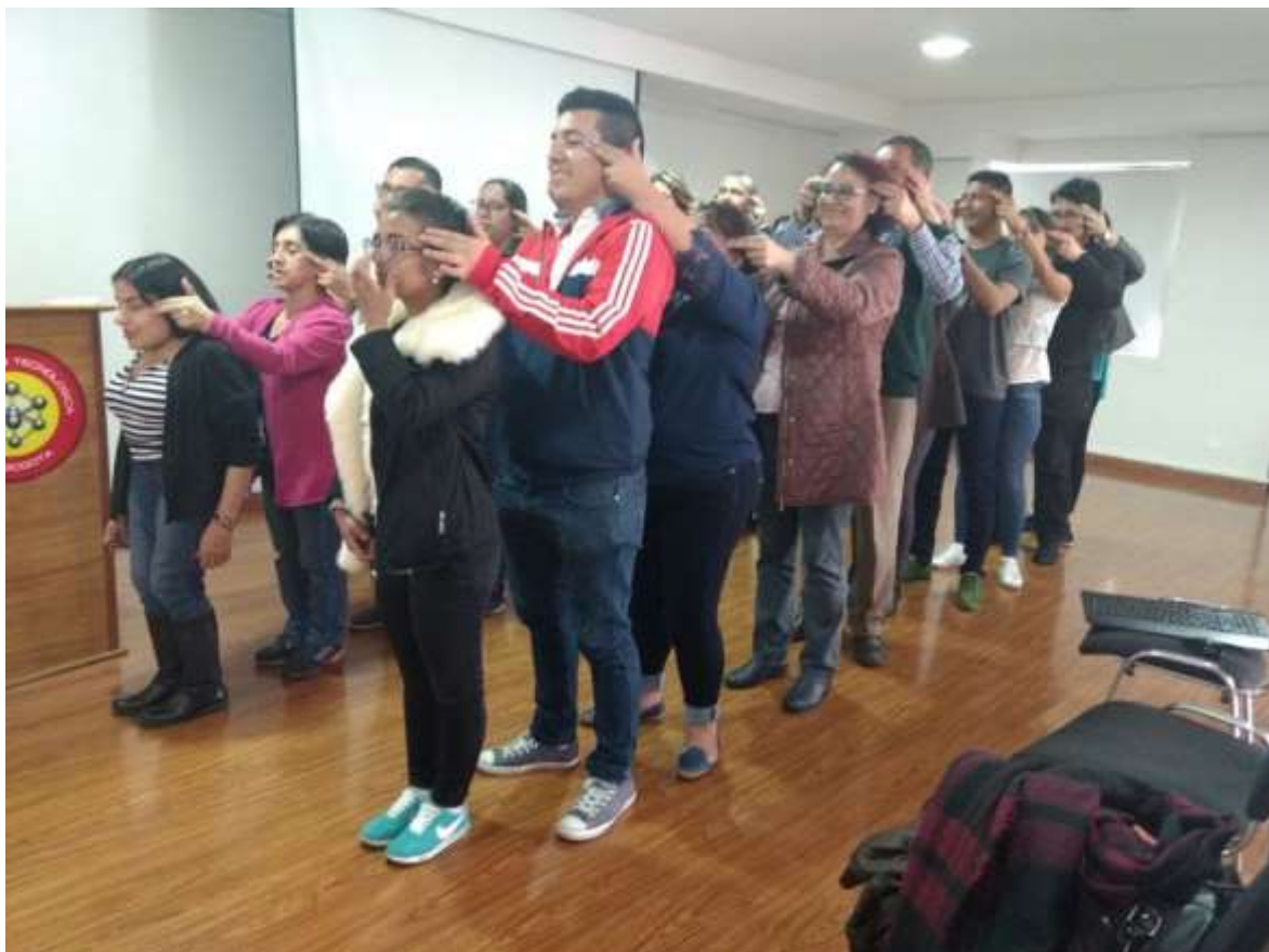
Actividades lúdicas y de integración a los funcionarios administrativos y docentes de la Corporación.

Con el fin de garantizar la protección de los derechos tanto de los estudiantes, como de la comunidad docente y administrativa, se cuenta con una estructura organizacional y criterios de definición de funciones y de asignación de responsabilidades, acordes con la naturaleza, tamaño y complejidad de la Institución.