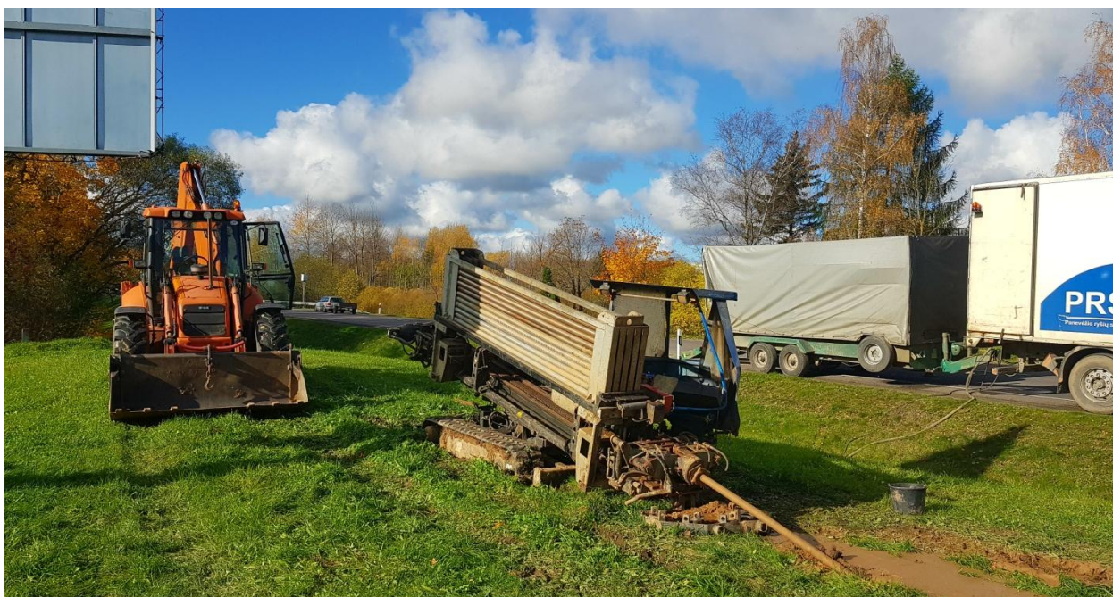
5 pav. Vandentiekio ir nuotekų tinklų statyba į Jasonių kaimą

Šiam projektui nustatyti stebėsenos rodikliai: 544 gyventojai, kuriems teikiamos vandens tiekimo paslaugos naujai pastatytais geriamojo vandens tiekimo tinklais, 634 gyventojai, kuriems teikiamos paslaugos naujai pastatytais nuotekų surinkimo tinklais, 544 papildomi gyventojai, kuriems teikiamos pagerintos vandens tiekimo paslaugos, 634 papildomi gyventojai, kuriems teikiamos pagerintos nuotekų tvarkymo paslaugos. Įvykdžius projektą bus sudaryta galimybė ne mažiau kaip 259 būstams prisijungti prie vandentiekio tinklų ir 302 būstams prie nuotekų tinklų, kad būtų pasiekti nustatyti stebėsenos rodikliai.