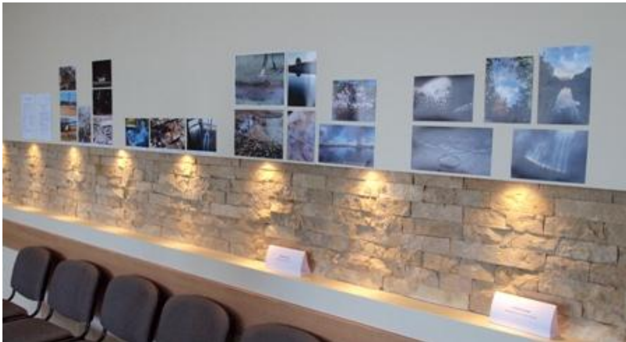
3 pav. Konkurso darbai

UAB „Utenos vandenys“ bendradarbiavo su Vilniaus Gedimino technikos universitetu (VGTU), Vilniaus universitetu (VU), Lietuvos žemės ūkio universitetu (LŽŪU), Kauno technologijos universitetu (KTU), Utenos kolegija, vykdam mokslinius tyrimus susijusius su nuotekų valymu, dumblo apdorojimu, bei organizuojant studentų praktikų atlikimą 17 studentams.