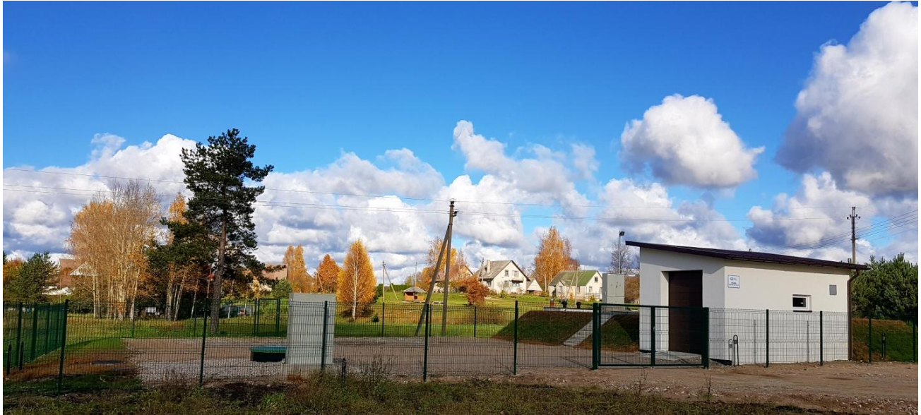
4 pav. Rekonstruota Šiaudinių kaimo nuotekų valykla

Ataskaitiniais metais įmonės darbuotojai daug dėmesio skyrė ankstesniais metais įgyvendintų projektų FAS sutartyse numatytų stebėsenos rodiklių pasiekimui, tęsė šiuos veiksmus: