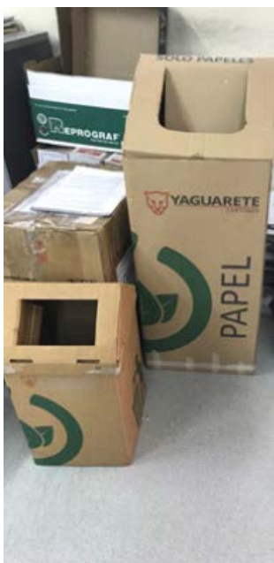
Contenedores de residuos para papel. Sectores: oficinas. Reciclado a través de la Empresa Cartones Yaguarete S.A.