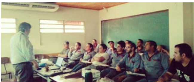
Curso de hidráulica