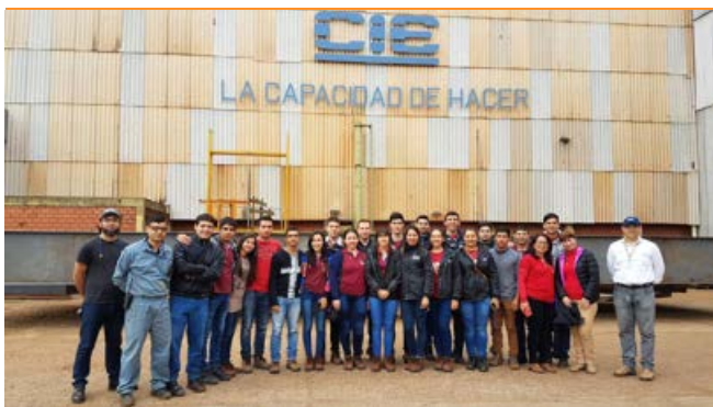
Alumnos del 4º Año de la carrera de Ingeniería Industrial de la Universidad Nacional De Pilar.