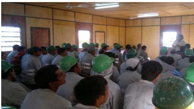
Charlas de Seguridad para Trabajos en Altura – LT 500 kV Yacyreta-Ayolas Villa Hayes.

En todos los proyectos constructivos en los cuales participa CIE SA se llevan a cabo jornadas de capacitación y educación dirigidas al personal de obras en todos los niveles de mando.