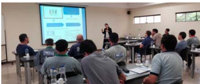
Curso de pintura