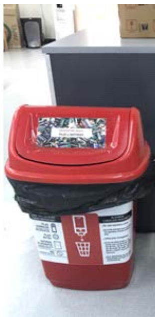
Contenedores de residuos peligrosos (pilas, baterías – cartuchos, tóner). Sectores: oficinas. Retiro y disposición final: Tayi Ambiental

Sigue en actividad el Comité de Gestión Ambiental, actualmente se encuentra en análisis el plan de adecuación e implementación de los requisitos adicionales de la versión 2015 de la Norma ISO 14001.