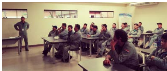
Charla sobre uso de equipos de protección