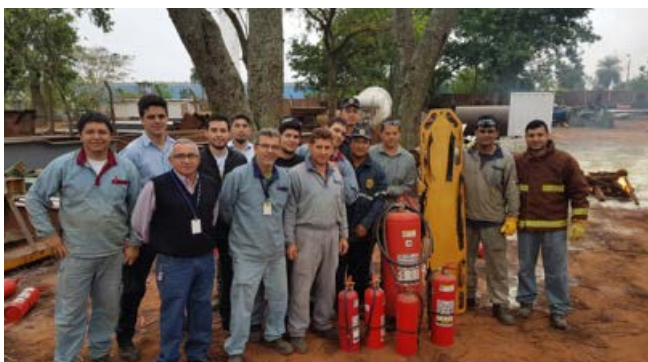
Capacitación a brigadistas: Uso y Manejo de Extintores.