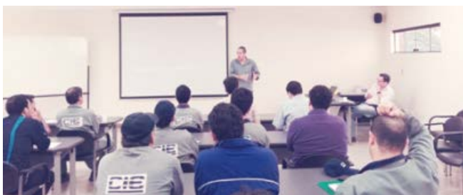
Curso de diagrama de proceso