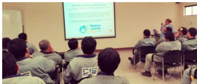
Charla sobre Intoxicación Alimentaria