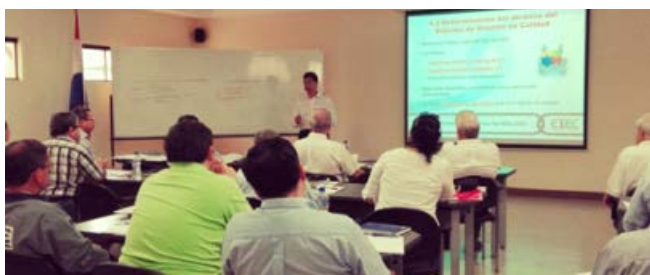
Curso de transición de la Norma ISO 9001-2008 A LA ISO 9001-2015