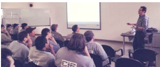
Curso sobre utilización de discos abrasivos

En materia de capacitación, en el año 2017 se totalizaron 2.182 hs de curso, con un índice de 26 hs/capacitación/año/funcionario y un nivel del cumplimiento de Plan anual de capacitación del 76%.