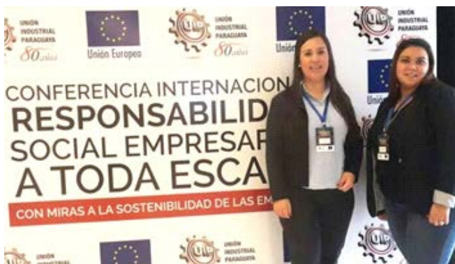
Conferencia internacional Responsabilidad Social empresarial con miras a la sostenibilidad.