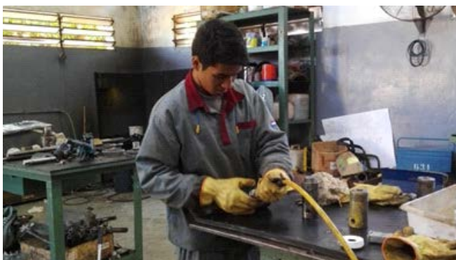
Pasante del área de Mantenimiento