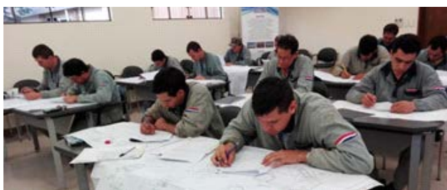
Curso de interpretación de planos