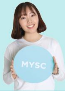
나 미 소 디자이너

매년 성장하는 조직과 변화하는 환경 가운데, 나침반이 단단한 중심축을 의지하여 방향을 찾아가듯, 중심을 갖고 끊임없이 올바른 방향을 찾으며, 방향이 필요한 주변에 그 방향을 공유하는 사내기업가가 되고자 노력하겠습니다.