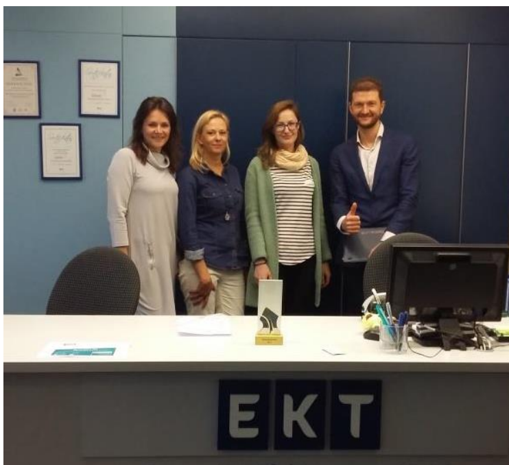
Susitikimas su konkurso „Verslas atsakingai“ organizatoriais

■ Pirmosios pagalbos mokymai skirti suteikti žinių ir įgūdžių, padėsiančių priimti teisingus sprendimus ir imtis užtikrintų veiksmų krizinėje situacijoje. Darbuotojai mokėsi suteikti pirmąją pagalbą nukentėjusiajam, įvykus nelaimingam atsitikimui ar staiga praradusiam sąmonę. Nors ir ne pirmą kartą, tačiau dabar darbuotojai yra pasirengę suteikti pirmąją pagalbą nelaimingo atsitikimo atveju sau, artimajam, draugui, bendradarbiui arba tiesiog nepažįstamajam.