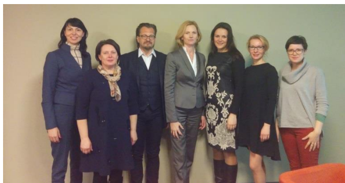
LAVA Valdybos rinkimai