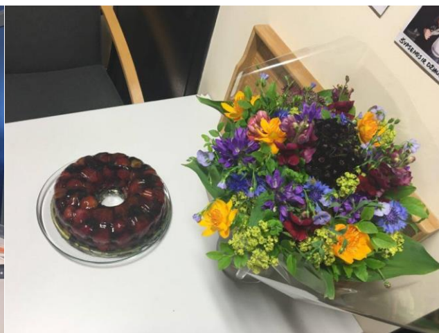
Sveikinimai įvairiomis progomis