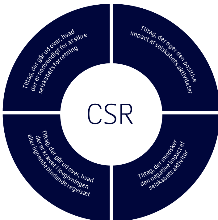
Figur 03 — Metroselskabets CSR-aktiviteter

Der kan imidlertid også være et ræsonnement i at vælge at arbejde med kategorierne "lille påvirkning, lille indsats" og "lille påvirkning, stor indsats", såfremt selskabet vurderer, at der er nogle særlige forhold, der gør sig gældende. Det kan for eksempel være, at selskabet ser en fordel i at gå forrest i branchen, en mulighed for at kunne opjustere standarden i branchen. Vælger selskabet at arbejde med tiltag indenfor disse kategorier, vil det altid foregå på baggrund af en konkret vurdering af det enkelte tiltag.