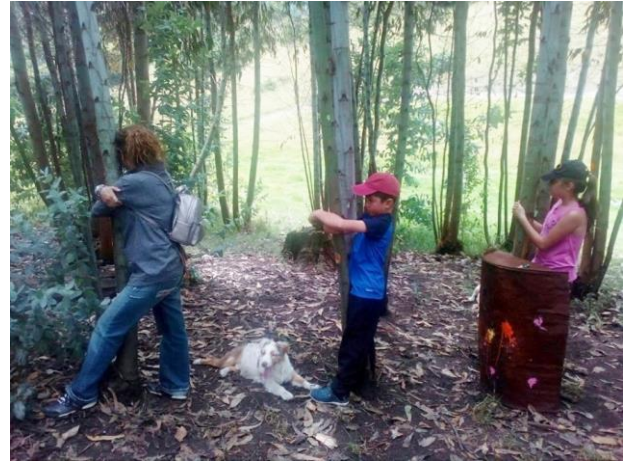
Abraza un árbol y conectate con la vida.