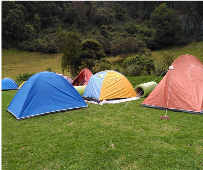
Camping de luna llena