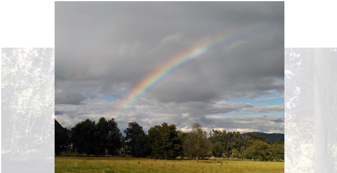
Restauración ecológica en el sector de manas del municipio de Cajicá, Cundinamarca.

La restauración ecológica es reconocida globalmente como una importante herramienta en los esfuerzos de conservación de la biodiversidad, para restituir la degradación ambiental y para moderar el cambio climático.