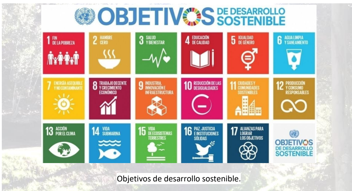
Objetivos de desarrollo sostenible.

También dentro de nuestro trabajo somos multiplicadores de lo que debe ser el cumplimiento de los objetivos de desarrollo sostenible. Hacemos énfasis en este conocimiento ya que a pesar de la gran difusión todavía es importante el número de empresarios y ciudadanos que desconocen estos compromisos.