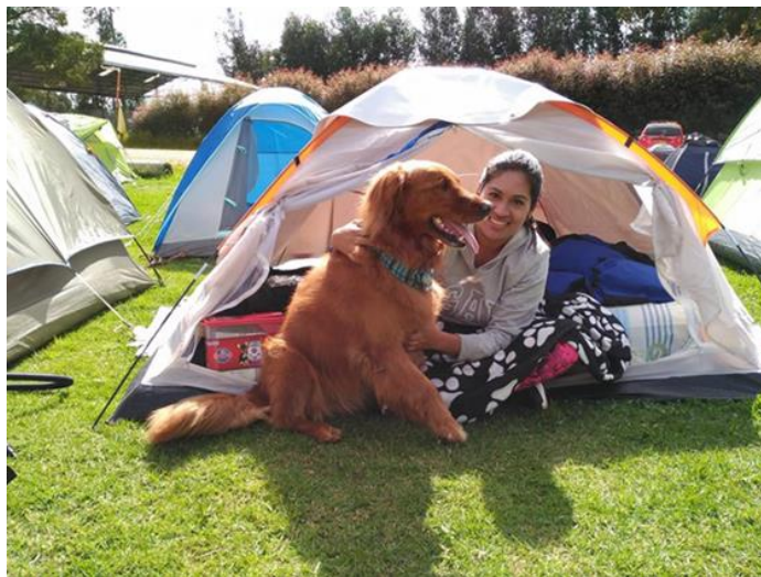
Siembra de árboles acompañados de mascotas.

Nuestra gran labor ha sido de sensibilización ambiental a través de actividades recreativas involucrando la familia, las mascotas, la empresa privada y pública mediante actividades como el camping, caminatas, ciclo montañismo, avistamiento de aves, oferta de espacios verdes pet friendly entre otros. Nos ha impulsado el gran amor que tenemos por nuestro país y por la naturaleza