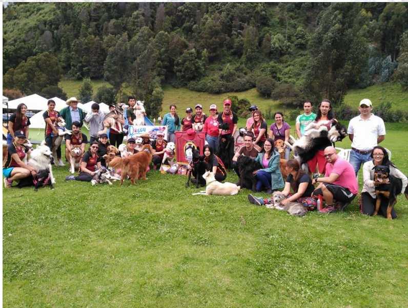
Caminata ambiental canina.