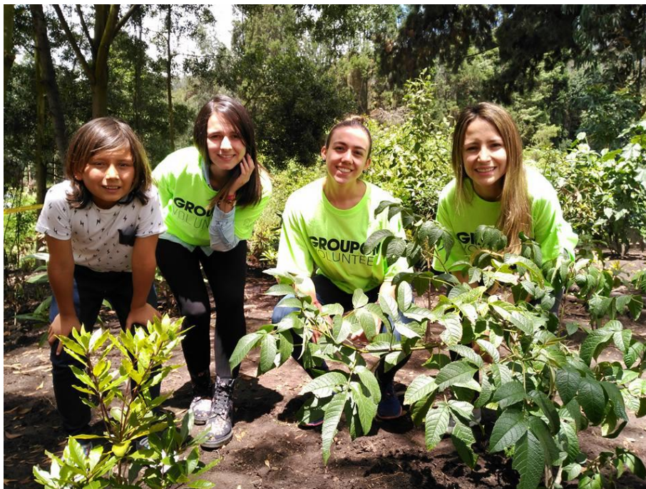
Responsabilidad social empresarial.

Principio 8: Las empresas deben fomentar las iniciativas que promuevan una mayor responsabilidad ambiental.