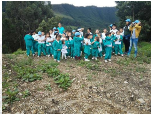
Salidas pedagógicas de los colegios.

Buscamos ampliar nuestra presencia en los colegios de la región mediante el apoyo a los planes ambientales escolares y orientar las investigaciones que realizan. Las investigaciones son de tipo cualitativo o cuantitativo o tener ambos componentes. La investigación de los PRAE debe ser aplicada pues soluciona problemáticas o necesidades de la comunidad educativa. Es importante priorizar la participación de la comunidad educativa en el diagnóstico de las necesidades o de la problemática a resolver, especialmente en el campo educativo ambiental.