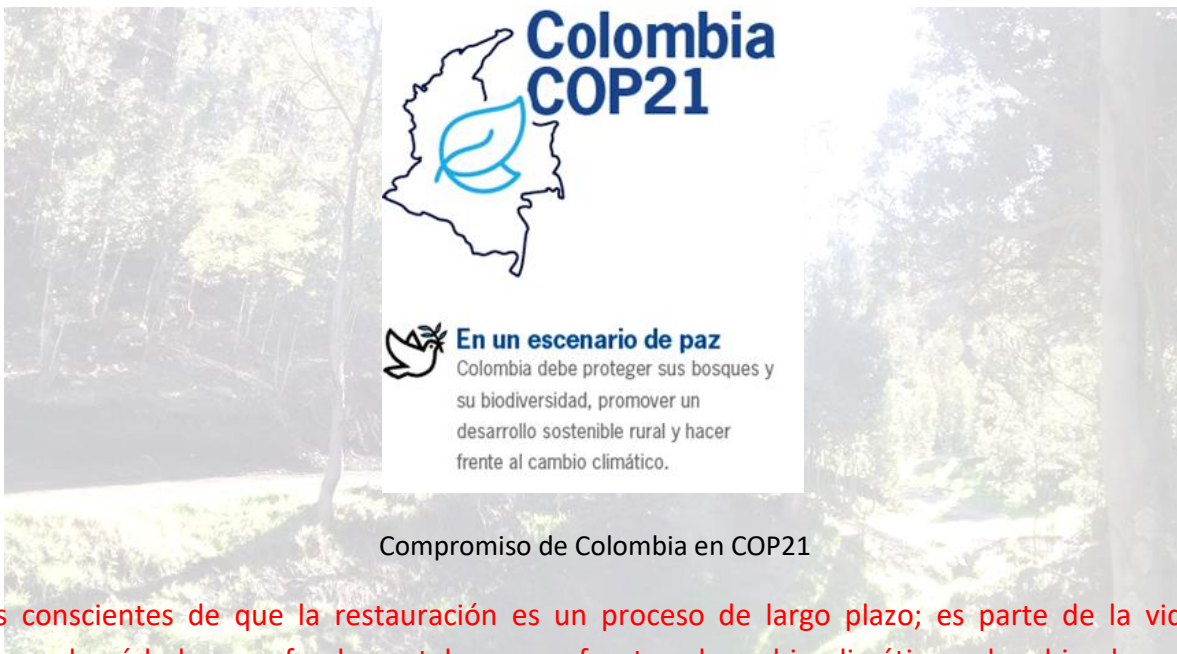
Compromiso de Colombia en COP21

Nos hemos propuesto apoyar el cumplimiento de los compromisos adquiridos por el Gobierno colombiano en COP 21. Colombia es el responsable del 0.46% de las emisiones de gases efecto invernadero a nivel global, según datos del Ideam de 2010. Sin embargo, esta participación tiene tendencia a crecer: se calcula que de no tomar medidas, las emisiones podrían aumentar en un 50% para el año 2030.