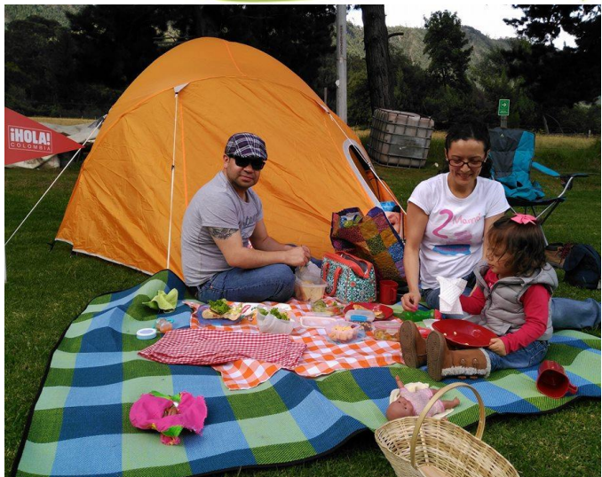
Puente festivo de camping