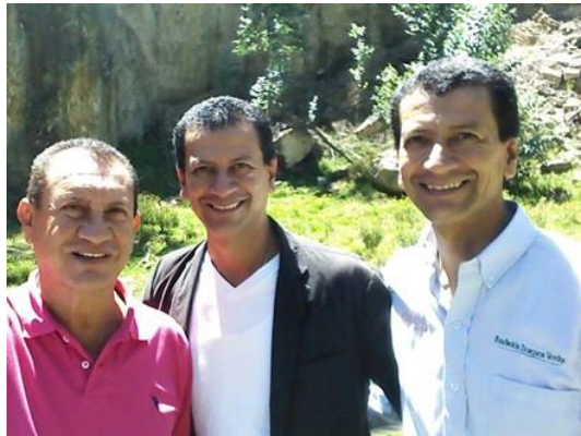
Gestores de la Fundación Bosques Verdes.