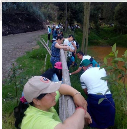
Comunidad participando en la siembra de árboles.

Las comunidades han tenido un papel pasivo en este tipo de proyectos. Sin embargo, nuestro interés es vincular a las madres cabeza de familia de la región para que tengan un ingreso digno y estén cerca a sus hogares.