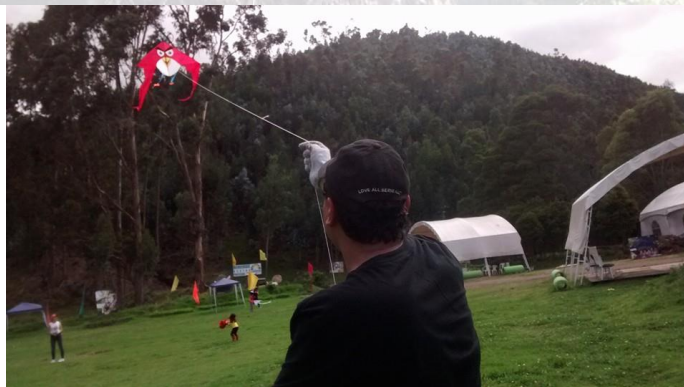
Día de campo en familia