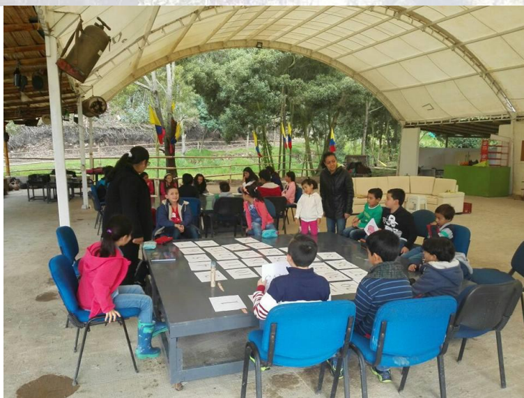
Arbol taller ambiental