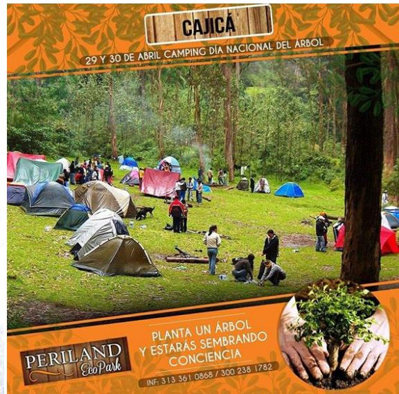
Planta un árbol y estarás sembrando conciencia.