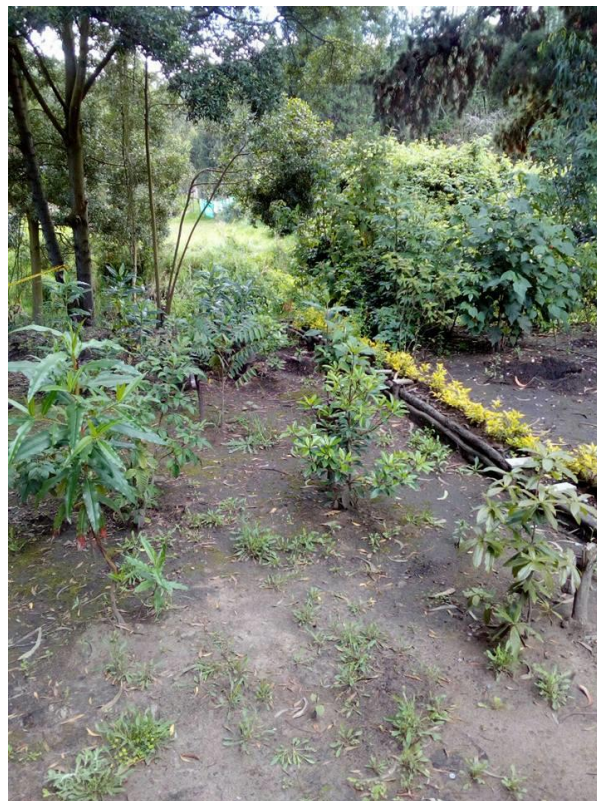
Bosqueton en periland siembra vida.