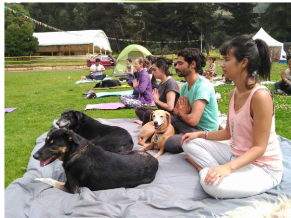
Llena tu vida de oxígeno.