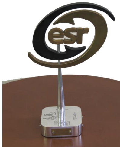
Obtención del Distintivo de ESR por 5° año consecutivo