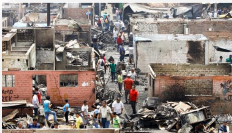
Más de 2000 personas se quedaron sin viviendas en Cantagallo.

A finales del 2016, la comunidad shipiba de Cantagallo sufrió un terrible incendio que dejó víctimas de quemaduras, damnificados y alrededor de 300 viviendas hechas cenizas. El GRUPORPP se sumó a los esfuerzos por Cantagallo y gracias a la solidaridad de cientos de personas, se logró recolectar más de 13 toneladas de ayuda humanitaria que fue llevada a los damnificados del siniestro.