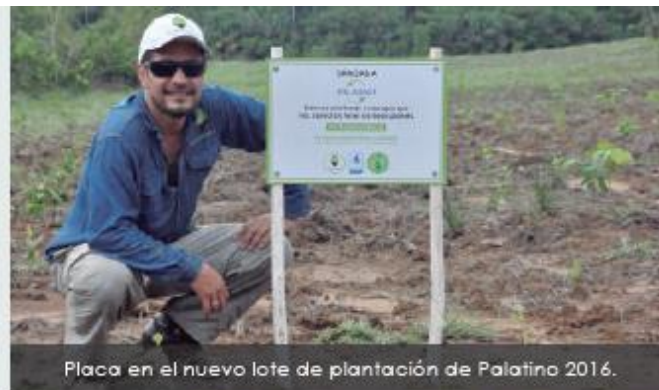
Placa en el nuevo lote de plantación de Palatino 2016.

SIEMBRA Y MANEJO Establecimiento, mantenimiento y control fitosanitario.