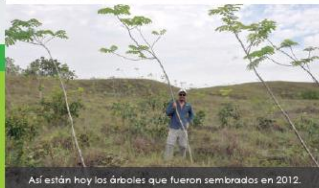
Así están hoy los árboles que fueron sembrados en 2012.