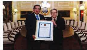
Premio Nobel en Ciencias Económicas 2007, Don Eric S. Maskin