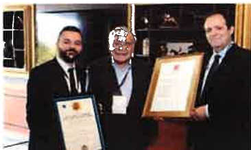
Premio Nobel de Medicina 1978, Werner Arber