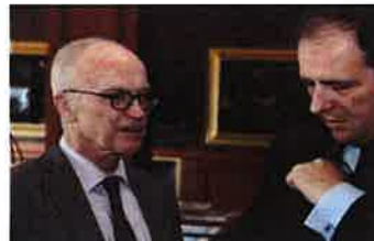
Premio Nobel de Economía 2004, Finn Erling Kydland