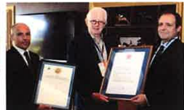
Premio Nobel de Medicina 1979, Sheldon L. Glashow

CONSEDOC está formado por 160 Miembros de Honor que han realizado aportes científicos, de investigación, sociales, culturales o empresariales importantes. Estos miembros son Doctores o Doctores Honoris Causa pertenecientes a distintas ramas del conocimiento, como Ciencias Económicas, Ciencias Jurídicas, Ciencias Sociales, Ciencias de la Salud y Ciencias Tecnológicas.