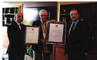
Premio Nobel de Medicina 1999, Richard John Roberts