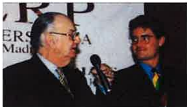
Premio Nobel en Literatura 1989, Don Camilo José Cela

Además, CONSEDOC busca el intercambio del conocimiento científico y potenciar la investigación entre entidades y asociaciones de diferentes puntos del mundo, organizando conferencias y encuentros y promoviendo la divulgación de publicaciones e informaciones de las que dispone la institución.