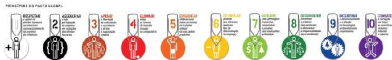
Figura 1 - Princípios do Pacto Global

O desenvolvimento sustentável faz parte do core business da Via Gutenberg, e com isso o compromisso para sua aplicação inicia-se “dentro de casa”, a partir do respeito a todas as pessoas com as quais nos relacionamos, visando à construção e manutenção de um relacionamento equilibrado, transparente e honesto.