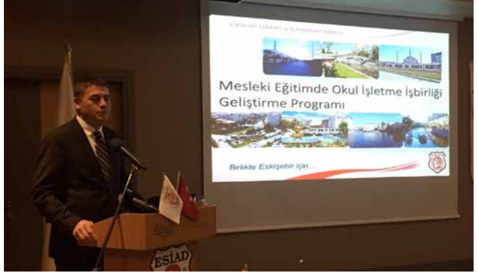
Okul-İşletme İşbirliğini Geliştirme Programı (2017)