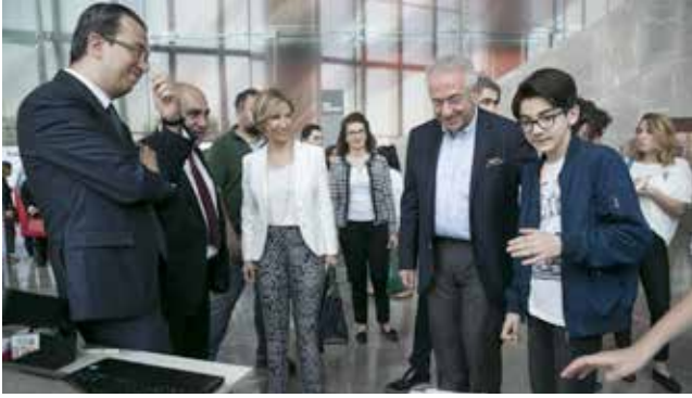
STEM Kiti ve Öğretmen Eğitim Projesi Kapanış Fuarı (4 Haziran 2017)