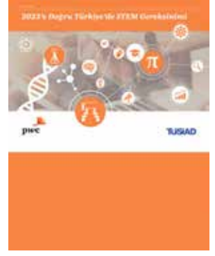
2023'e Doğru Türkiye'de STEM Gereksinimi

ile ilgili çeşitli göstergeleri ve cinsiyet eşitliğine yönelik şirket politika/programlarını öğrenmek amacıyla iki anket hazırlanıp, bu anketler 102 şirketten insan kaynakları yöneticileri tarafından dolduruldu.