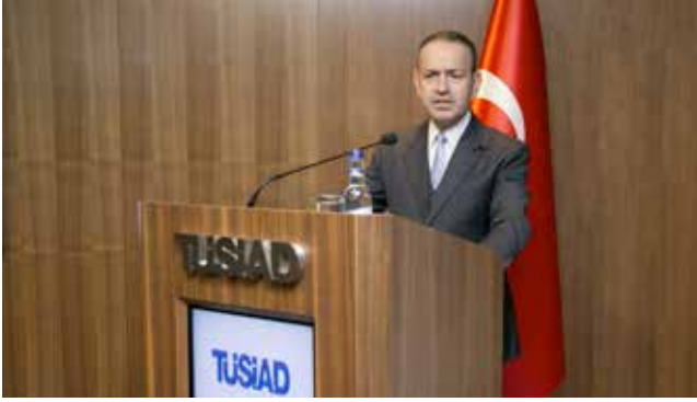
Atık Yönetimi İstişare Toplantısı (16 Mayıs 2017)