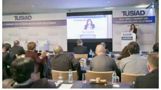
Bilgi Temelli Yetişkin Becerilerini Geliştirmek Semineri (28 Kasım 2016)

eğitim yöneticileri ve eğitim politikası uzmanlarının katılımıyla yapılan toplantılarda kayıt edilen görüşlerden yararlanılarak bir TÜSİAD görüş belgesi hazırlandı (20-21 Ekim 2016).