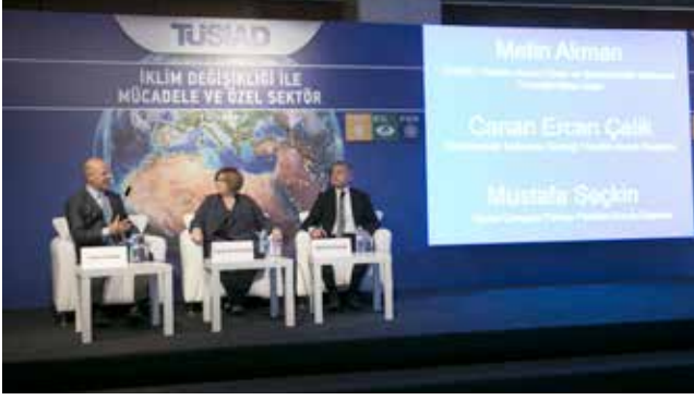
İklim Değişikliği ile Mücadele ve Özel Sektör Konferansı (5 Aralık 2016)