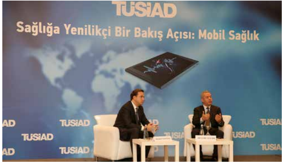
Sağlığa Yenilikçi Bir Bakış Açısı: Mobil Sağlık