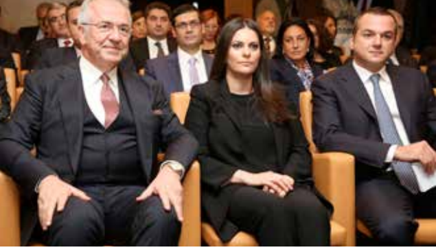
Çalışma ve Sosyal Güvenlik Bakanı Jülide Sarıeroğlu'nun TÜSİAD Ziyareti (28 Eylül 2017)

ardından, MESS Eğitim Vakfı'nın METAD (Mesleki Eğitime Tam Destek) projesi kapsamında aynı paydaşlar ile Bursa'da aynı program uygulandı.