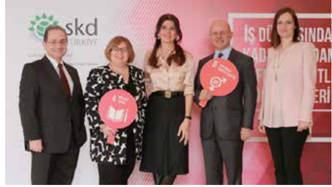
İş Dünyasından Kadın İstihdamı ve Fırsat Eşitliği Deneyimleri Toplantısı (20 Mart 2017)