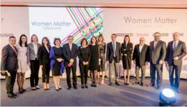
Women Matter 2016