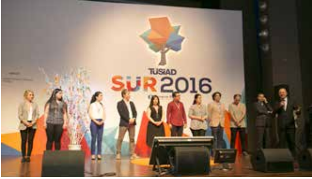
SÜR 2016 (2 Haziran 2016)