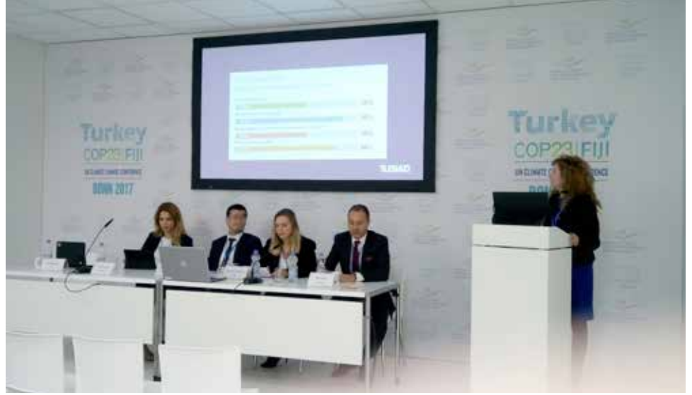
23. Taraflar Konferansı (6-17 Kasım 2017)