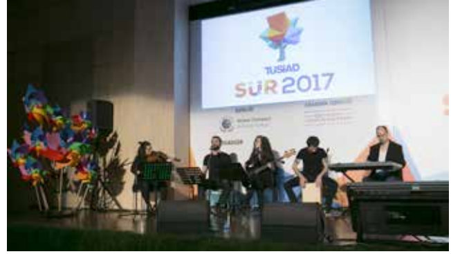
SÜR 2017 (23 Mayıs 2017)