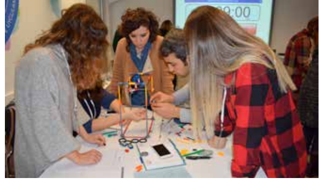
STEM Öğretmen Eğitimleri (2016)

Çatı Gönüllüleri tarafından eğitimler verildi. Eğitimlerin ardından şirketler, aile içi şiddete yönelik şirket politikası oluşturma ve uygulama sürecine geçti (Nisan-Kasım 2016).