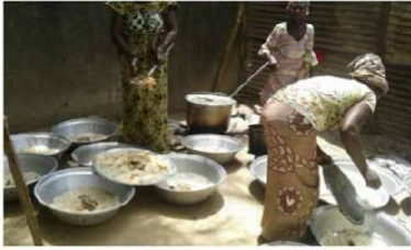
Colaboración comedor de colegio de SELEKY en SENEGAL