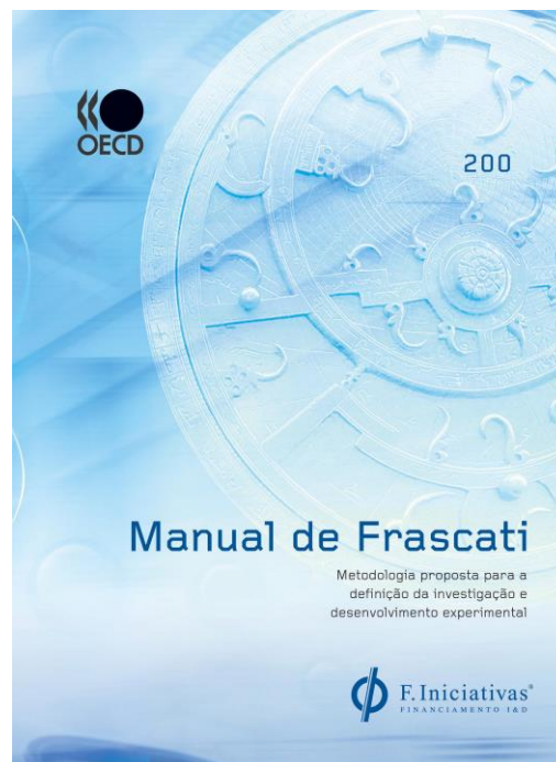
ex. Manual Frascati