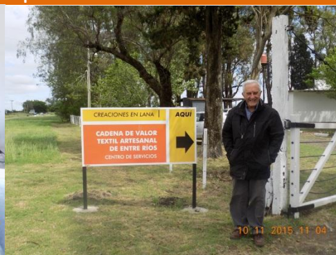
Programa Ruta 127/12 – Centro de Servicios Cadena de la Lana