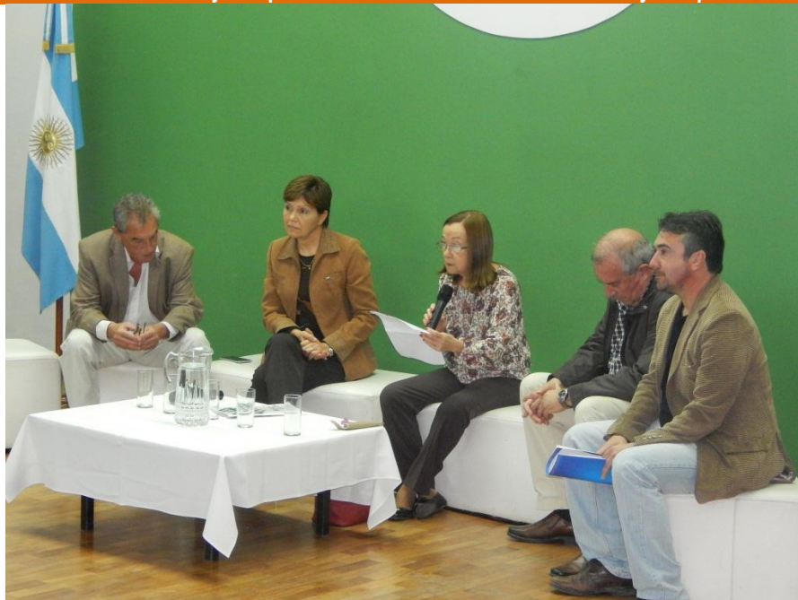
Congreso Entre Ríos Responsable – Panel de empresarios socios del CEER