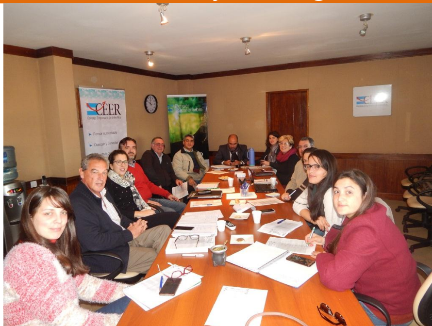
Reunión de Consejo de políticas sociales en la sede del Consejo Empresario