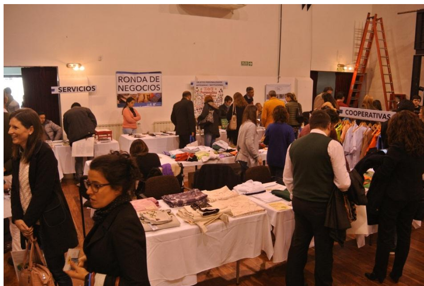
Ronda de Negocios Emprendimientos sociales