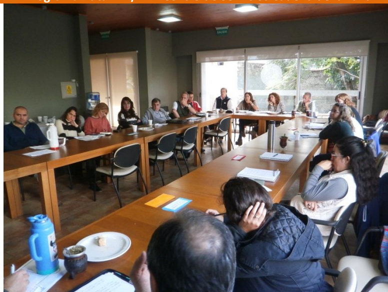
Programa Ruta 127/12 – Reunión institucional de la Mesa Coordinadora