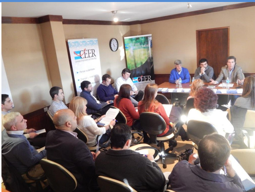
Presentación Ministerio de Trabajo de la Nación – Programa Empleo