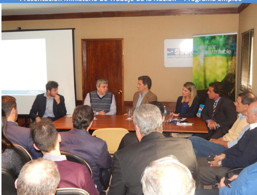
Presentación Ley Riesgo de Trabajo – Superintendencia de Seguros de la Nación