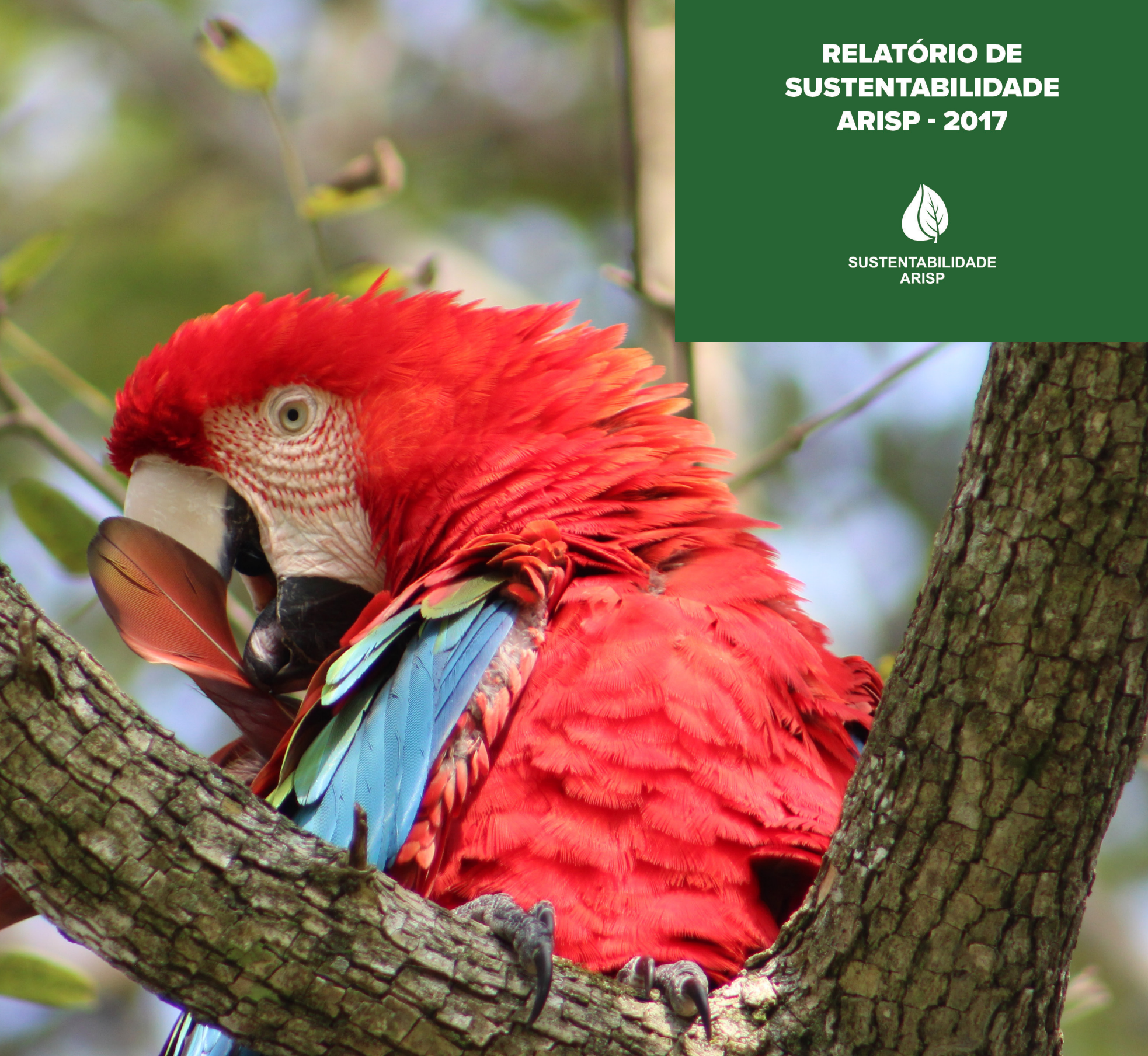
FOTO PREMIADA NO CONCURSO FOTOGRÁFICO DA ONU, NA CATEGORIA “ODS 15 – VIDA TERRESTRE” DE AUTORIA DA GESTORA AMBIENTAL DA ARISP – VERIDIANA AGUIAR.