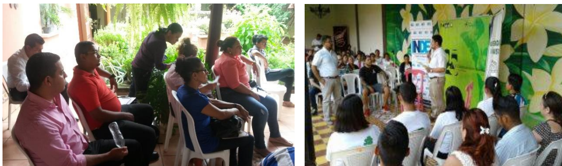
Capacitación a socios, colaboradores

Como beneficios adicionales a lo establecido en la legislación laboral nacional, INDE, ofrece a sus colaboradores beneficios como: capacitaciones de actualización y al final del año cada colaborador recibe un bono navideño.