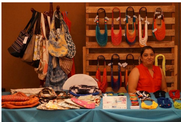
Socias de INDE emprenden sus negocios