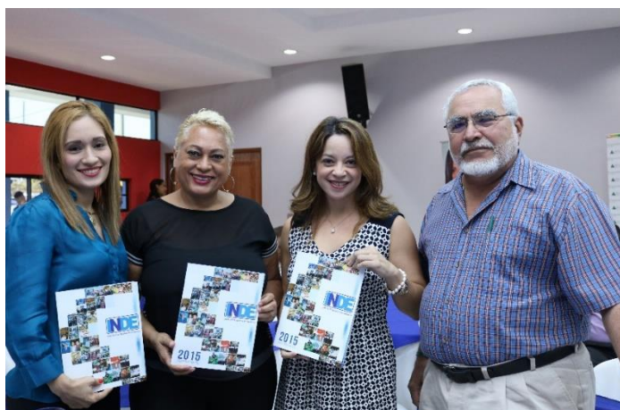
Miembros de la Junta directiva de INDE

La política institucional de equidad de género de INDE cuenta con un plan de acción que facilitará la consolidación de los procesos ya en marcha, e iniciar aquellos que se identificaron como relevantes para el proceso de sensibilización sobre los derechos humanos, específicamente la igualdad y equidad de género, como parte de los mismos.