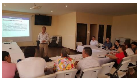
Mujeres y jóvenes del capítulo INDE Chontales participan en el taller de incidencia política pública

INDE como parte de su actuar en los temas de derechos laborales, realizó actividades de análisis y reflexión acerca de los factores que influyen en la organización y fortalecimiento de cada uno de los capítulos departamentales. Para su cumplimiento se realizaron actividades: talleres e procesos de incidencias en políticas públicas que les permita garantizar la incorporación efectiva de las mujeres, jóvenes y socios de INDE. En esta actividad los participantes tomaron las mejores prácticas en el uso de instrumentos para la participación ciudadana.