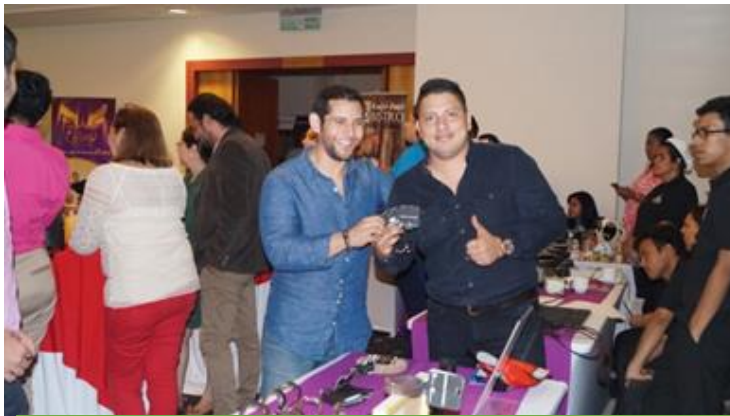
Empresario socio de INDE participando en el encuentro empresarial

El propósito principal de INDE es que todos los colaboradores de la organización y todos los socios respeten la Declaración Universal de los Derechos Humanos