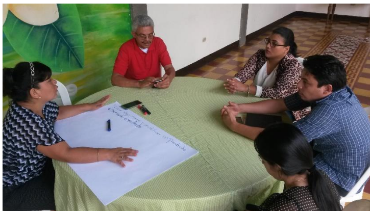
Mujeres y jóvenes capítulo INDE Masaya participan en el taller de liderazgo

Así mismo, durante la ejecución del proyecto se impulsó desde los capítulos departamentales de INDE, la promoción de una cultura de inclusión de las mujeres y jóvenes en la generación de soluciones proactivas de los problemas actuales en las localidades y en el país a través de la búsqueda de soluciones sostenibles que reflejan el trabajo tripartito – empresa – gobierno – sociedad civil.