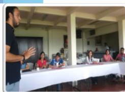
Plan de negocios Chontales