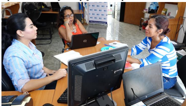
Secretarias ejecutivas y Juntas Directivas de los capitulos departamentales de INDE, en los procesos de capacitacion de liderazgo

Así como facilitar los conocimientos y elementos metodológicos para el diseño, creación y desarrollo de emprendimientos y empleos con mujeres y jóvenes que se encuentran agremiadas en los capítulos departamentales de INDE. Además de promover el seguimiento continuo para el fortalecimiento de actividades de emprendimiento responsable. Propiciando la creación de espacios dinámicos y alianzas multisectoriales para el desarrollo de iniciativas que permitan incidir de manera activa a las mujeres y jóvenes asociados en los capítulos departamentales para que sean partícipes de su propio desarrollo.