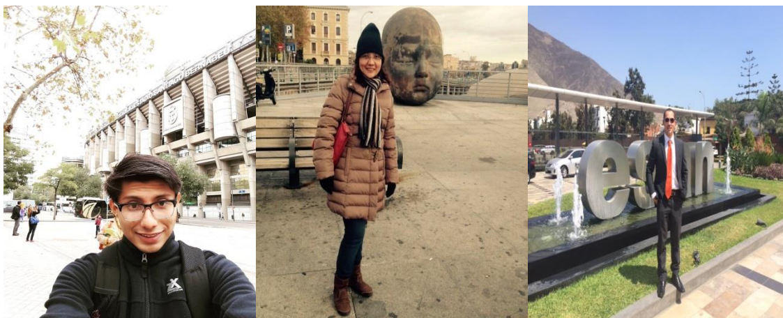
Jóvenes beneficiarios con créditos para estudios de especialización

“Pensar en desarrollo, es pensar en mejorar los índices de productividad y competitividad a través de la educación”.