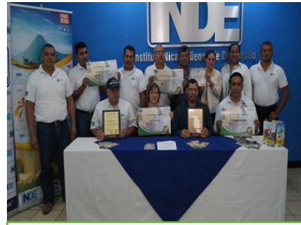
Ganadores de premios en la Feria nacional del queso

En los próximos años tenemos que continuar generando confianza y aumentar la cooperación de los organismos internacionales, para lograr importantes avances institucionales. Por otra parte, debemos seguir en la incansable labor a favor del desarrollo sostenible a lo largo y ancho del país. Porque construir una nación es tarea de todos.