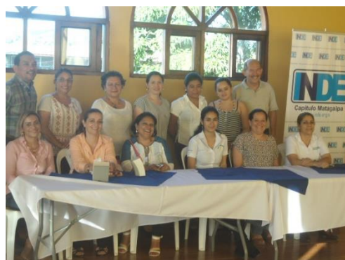
Mujeres y jóvenes del capítulo INDE Matagalpa participan en el taller de Responsabilidad Social

El Instituto Nicaragüense de Desarrollo (INDE) es una de las instituciones pioneras en el impulso de la responsabilidad social empresarial en Nicaragua, es por eso que anualmente reflexiona sobre la situación actual, y se facilitan talleres sobre la temática de empresa y responsabilidad social en donde se abordan contenidos relacionados al respeto de opiniones, participación individual, siendo la mejor manera que todos los colaboradores aprendan y comprendan sobre el respeto de las opiniones.