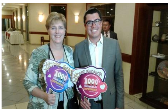
La Embajadora de Estados Unidos en Nicaragua y el presidente de la Junta directiva de Emprendedores Juveniles apoyando al programa de mil maneras de emprender.

La organización contribuyó a la creación del programa televisivo “Mil Maneras de Emprender”, tiene además un espacio en el programa “Virtual Machine” que se transmite por Canal 6 y en el segmento televisivo “Martes Emprendedor” del programa “Primera Hora” de Canal 2.