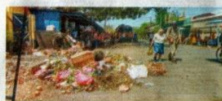
UNA CALLE CERCANA A LA TERMINAL DE BUSES.

"Se trata de que la ciudadanía tome conciencia de que la limpieza e higiene contribuyen con la salud y el bienestar de