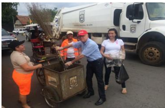
Alcalde de León en alianza con la Junta Directiva del Capítulo departamental INDE en Leon en Jornada

INDE a través de su amplia red de capítulos departamentales, ha fortalecido su actuar a nivel territorial, logrando una mayor incidencia en políticas públicas, llevando oportunidades a cientos de mujeres y jóvenes que participaron en cada uno de los procesos formativos.