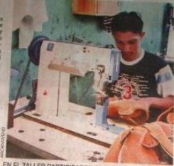
EN EL TALLER PARTICIPARON 50 EMPRESARIOS.

Agregó que en el departamento de León existe bastante demanda