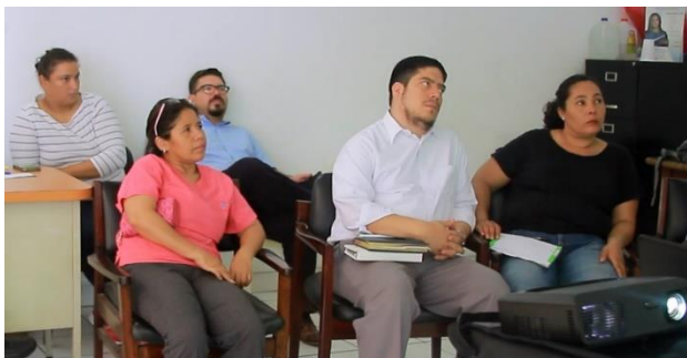
Junta Directiva del Capítulo Masaya en los procesos de capacitación

Sin embargo, después de los procesos de capacitación ejecutado por INDE en los temas de incidencia en políticas públicas, el cambio fue positivo, les permitió mayor apertura de parte de los directivos de negociar con las autoridades municipales