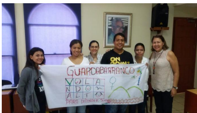
Colaboradores de INDE en los procesos de capacitación

Durante este proceso de coordinación se realizaron dos talleres de 2 días para abordar las