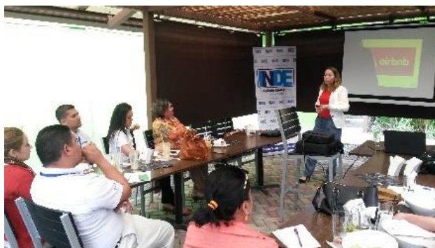
Taller de mercadeo digital

A los socios de INDE se les facilitó el tema de cyberactivismo/redes sociales en donde se abordaron los contenidos de “técnicas de aprendizajes de incidencia en políticas públicas a través de las redes sociales”