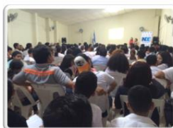
Taller de seguridad digital Matagalpa