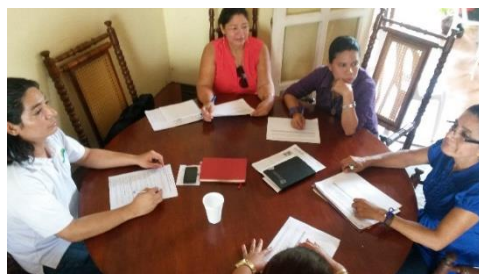
Mujeres y Jóvenes capítulo INDE granada participan y fortalecen sus capacidades en temas de gestión del conocimiento

INDE tiene como propósito lograr que los capítulos departamentales fortalezcan sus capacidades, técnicas y habilidades blandas en temas de gestión de conocimientos en este proceso se promueve la inclusión de mujeres y jóvenes, así también, se consolidan y fortalecen a las mujeres y jóvenes emprendedoras.