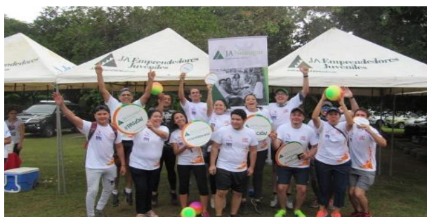
Caminata de Emprendedores Juveniles

Sus principales aliados fueron: Centro de Comunicación y Educación Popular (CANTERA), Polaris Energy Nicaragua, S.A - PENSA, Plan Internacional, Instituto Nicaragüense de Desarrollo (INDE), Universidad Iberoamericana de Ciencia y Tecnología (UNICIT), Universidad Nacional Autónoma de Nicaragua (UNAN – Managua/León), Universidad Cristiana Autónoma de Nicaragua (UCAN), Universidad Humanística (UNEH), Universidad Hispanoamericana (UHISPAN), Fabretto, Farmer2Farmer, Red Emprende, Báez Cortes, Arias y empresas del sector privado.