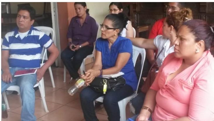
Mujeres y jóvenes capítulo INDE Granada participan en el taller de innovación

Debido a que las mujeres y jóvenes asociados a los capítulos departamentales, requirieron fortalecerse con temas actuales, tales como: procesos de incidencia, innovación, emprendimiento y además tenían poco acceso a programas sobre estos temas, INDE consideró en sus planes estratégicos la necesidad de impulsar el fortalecimiento de las capacidades organizativas en temas de liderazgo a través del emprendimiento que beneficiara a la