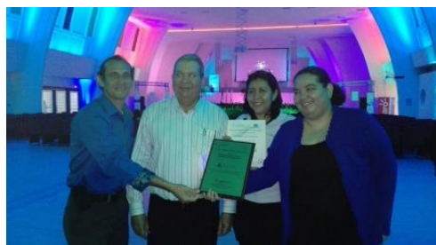
Recibiendo reconocimiento del CONICYT

Emprendedores Juveniles – JA Nicaragua también recibió reconocimiento del Consejo Nicaragüense de Ciencia y Tecnología (CONICYT) por su trayectoria y apoyo a las diferentes actividades desarrolladas durante la Semana Nacional de la Ciencia.