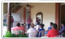
Incidencia en políticas públicas Granada