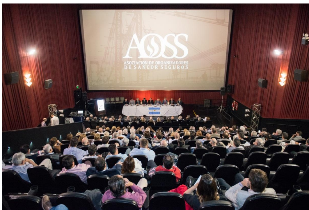
Asamblea General AOSS