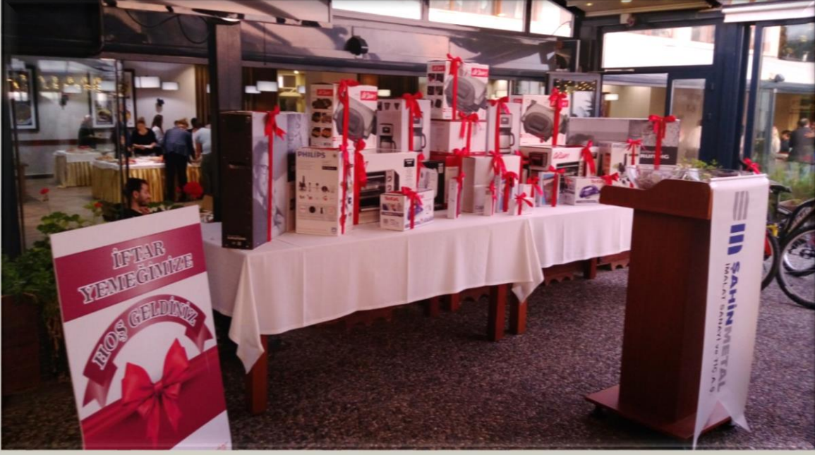
2017 yılında verdiğimiz iftar yemeğinden görüntüler