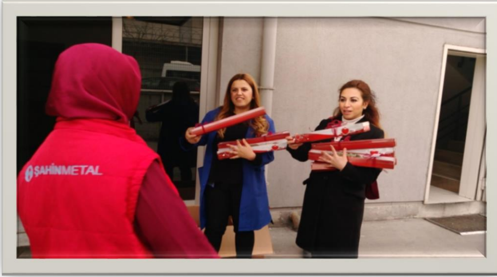
8 Mart 2017 Dünya Emekçi Kadınlar Gününden Görüntüler

Özel gün etkinliklerimize “8 Mart Dünya Emekçi Kadınlar Günü “kutlamasını ekledik. Kadın istihdamın ülke ekonomisi ve kalkınma için önemli bir güç olduğuna inanıyor, Şahin Metal olarak kadın istihdamına verdiğimiz önemin kararlılıkla devam edeceğini taahhüt ediyoruz.