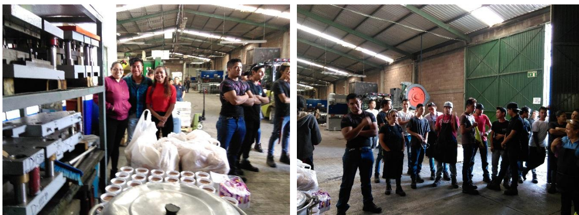
Convivio para festejo del altar de muertos.