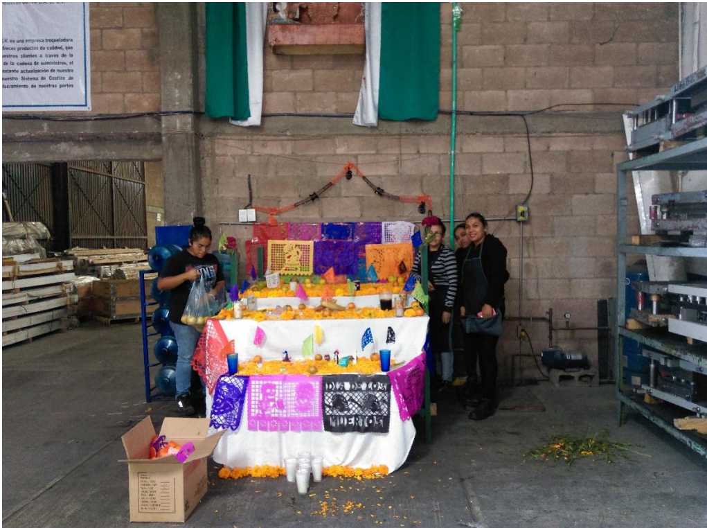
Personal participando en la decoración del altar de muertos.

Actualmente se comenzará a programar diferentes fechas dentro de ellas, la fecha de aniversario de la empresa, festividades donde se incluya la familia como parte de motivación.