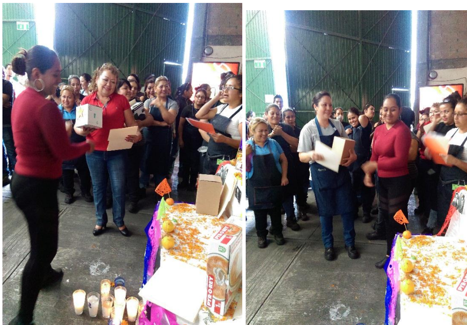
Premiación al personal que participo en las calaveritas de MMc-2017.