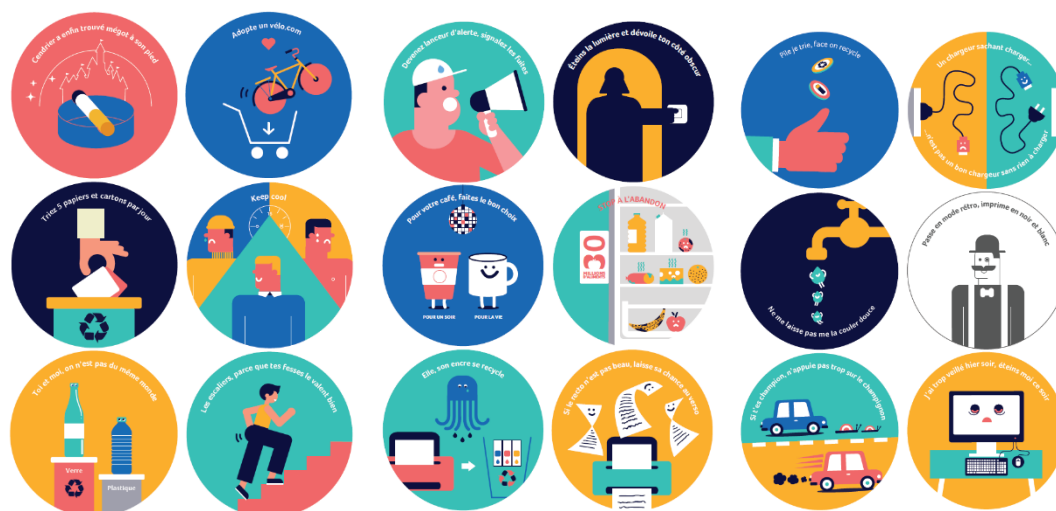
Stickers de sensibilisation aux écogestes créés par GreenFlex en 2017 sur la base de jeux de mots proposés par les collaborateurs de GreenFlex