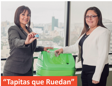
“Tapitas que Ruedan”