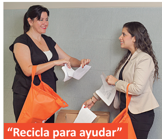
“Recicla para ayudar”