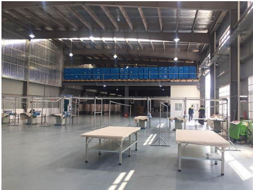
Almacén de Simeí en China: N° 2, Pengqing Street, Kunshan, Jiangsu Province, China.

A través de nuestra filial china, Simeí, realizamos trabajos de Re-works como planchado, emperchado o embolsado de prendas.