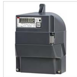
スマートメーター（イメージ）

東急不動産（株）は、分譲するマンションにおいてスマートメーターの設置を進め、エネルギー利用の見える化を推進しています。「ブランド札幌中島公園」では、スマートメーターを標準設置し、通信を介して30分単位で電力使用量の自動で検針しています。