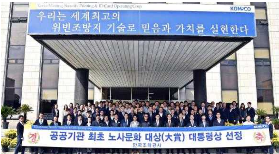
< 공공기관 최초의 노사문화 대상(大賞) 대통령상 선정 기념촬영 >