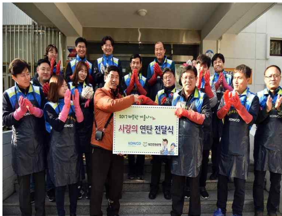
<사랑의 연탄나누기 봉사>