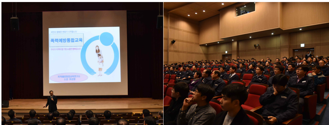
< 전 직원 대상 성폭력 예방교육 실시 >