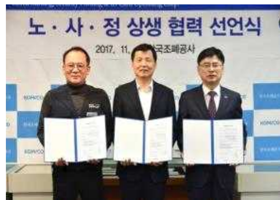
< 노·사·정 상생협력 선언식 >