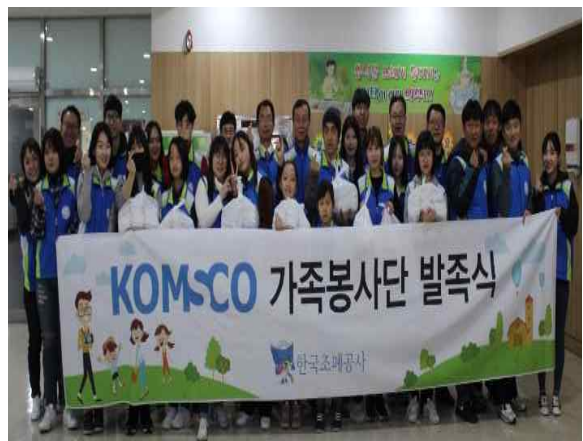
<가족과 함께 김밥만들기 봉사>