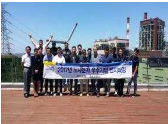
< 노사문화 우수기업 벤치마킹 >