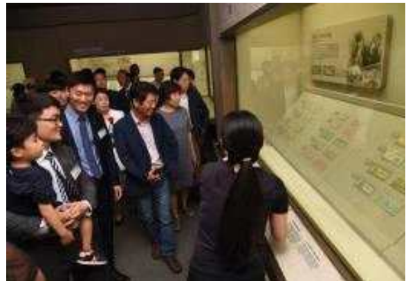
<신입직원 부모님 초청행사(2017년 7월)>