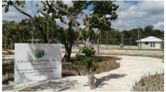
Proceso de construcción del parque, cancha y centro comunitario de Verón