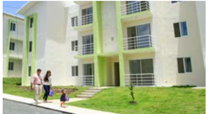
Proyecto inmobiliario, Ciudad Caracolí