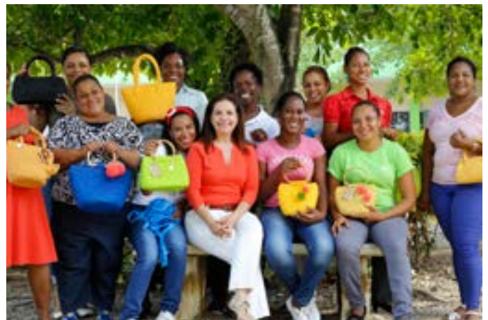
Taller Artesanal Nuestra Señora de Punta Cana