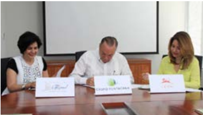
Firma acuerdo con Centro León y Fundación E. León Jimenes