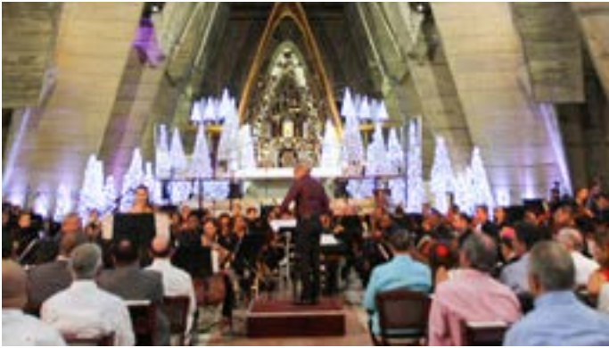
Concierto Gala de Villancicos 2016