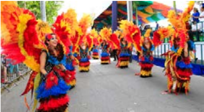
Carnaval Punta Cana 2016