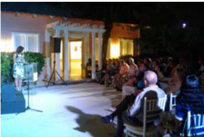
Segundo Festival de Poesía Puntacana Village