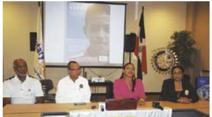
Reunión Club Rotario Punta Cana Bávaro