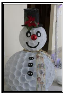
Boneco de neve feito com copos de plástico