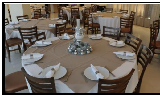
Porta guardanapos feitos com tubos de papelão e sementes de girassol para posterior plantio

A confraternização de fim de ano dos colaboradores da GLP também contou com uma atenção especial quanto à utilização de materiais recicláveis em sua decoração.